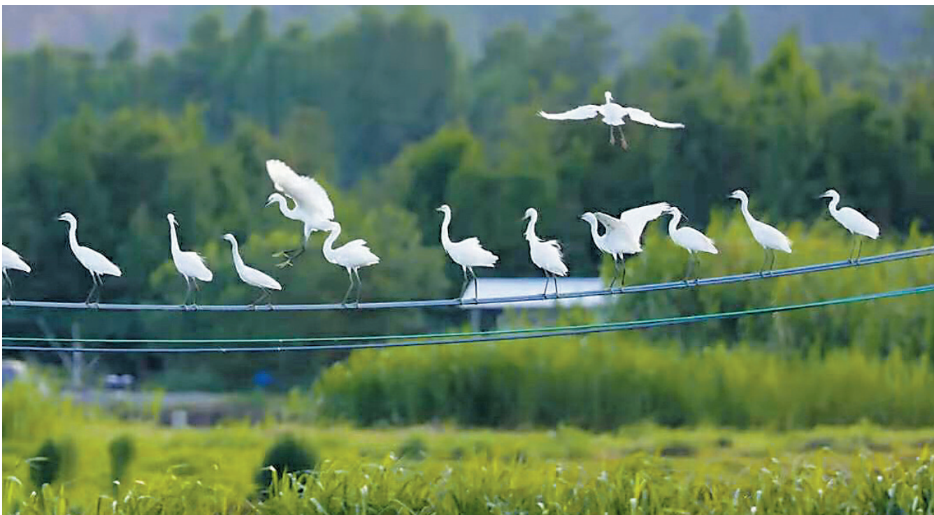
栖息在珠海南澳村的白鹭