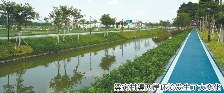
梁家村渠两岸环境发生了大变化

羊城晚报讯 记者余晓玲,通讯员梁雪君、曹木静摄影报道:绿道、驿站、休闲廊架、观赏平台……近日,东莞市石碣镇梁家村渠碧道建成开放,这条横贯整个村庄长达 2.43 公里的碧道成为市民休闲娱乐的好去处,也为石碣生态文明建设增添了一个新的展示窗口。