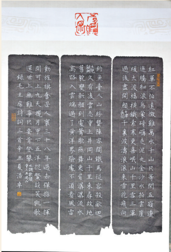
參賽作品 (硬筆中學組，作者：陳浩卓)

家協會會員、廣東省書法家協會副主席、東莞市文學藝術界聯合會主席周漢斌，中國書法家協會會員、廣東省書法家協會理事、東莞市書法家協會主席黃貴田，中國書法家協會會員、廣東省書法家協會理事、東莞市書法家協會駐會副主席兼秘書長黃品功等擔任評委，經過公平、公正的評選，初賽中共評出100名優秀小書法家參加決賽，入圍獎共236名。