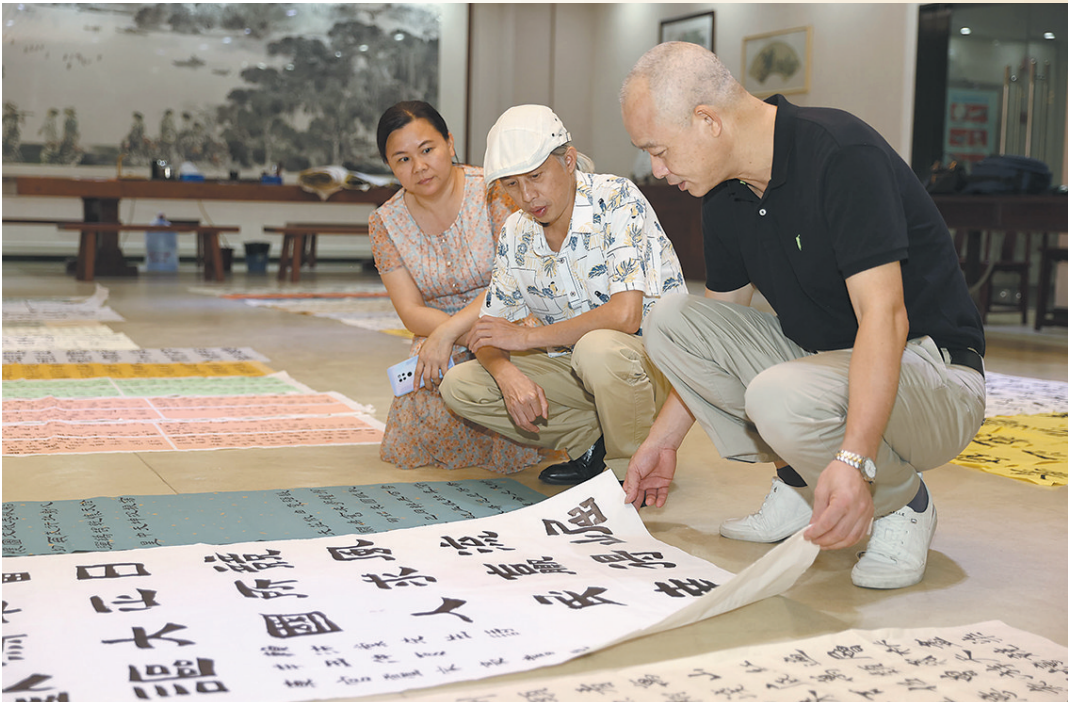
評委對征集的作品進行評選