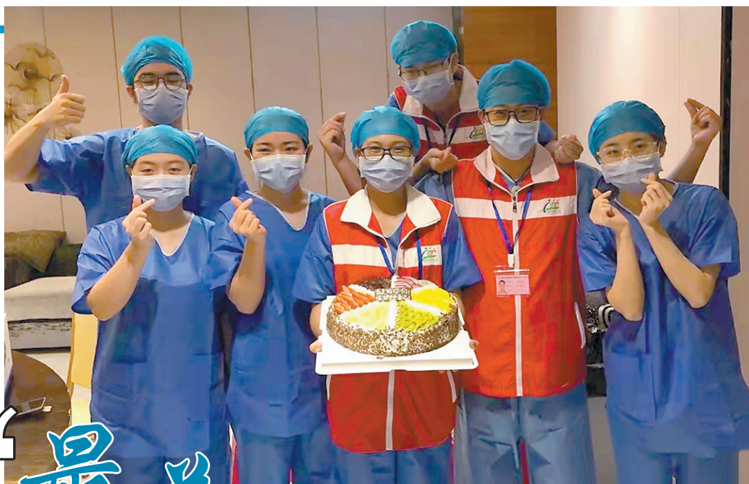
医护人员收到“甜心”礼物

据悉,“2021东莞共享文化年”系列“十佳”评选将于11月完成,并于年底在闭幕式上进行正式发布和表彰。