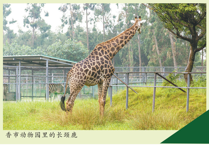
香市动物园里的长颈鹿

据介绍,教师节期间,广大教师前来香市动物园,可以观看国宝大熊猫、高大的长颈鹿、威猛的老虎、可爱的环尾狐猴等珍稀野生动物,欣赏综合表演杂技表演、海洋动物表演,探寻最大的陆地基地,观赏苏卡达龟,还可以参加共享自然营地篝火晚会。带上孩子一起参加香市动物园首届亲子钓鱼大赛,冠军家庭还将有幸获得10000元的奖金。