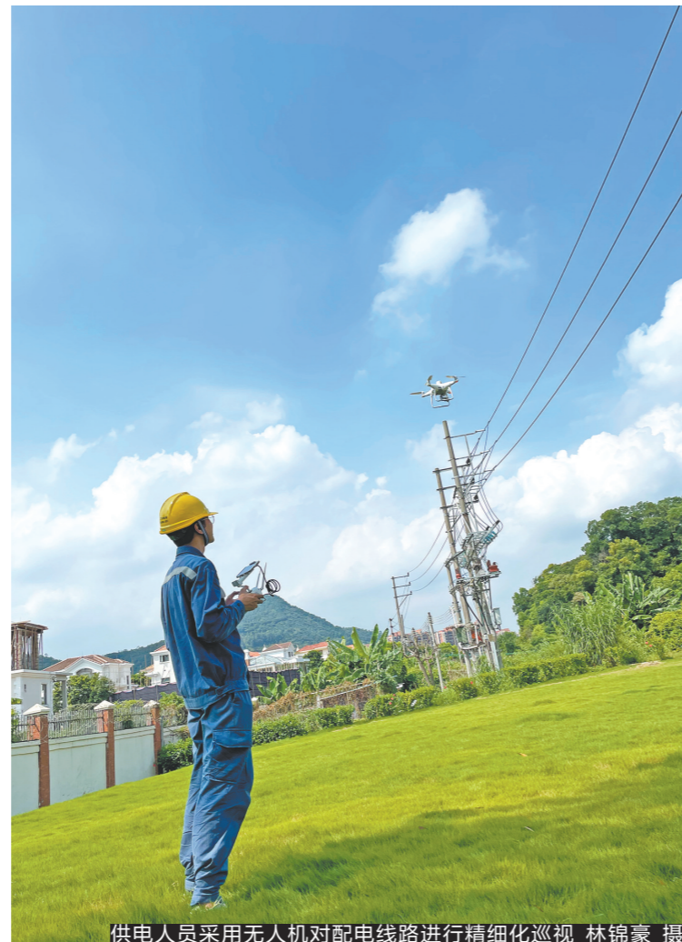
供电人员采用无人机对配电网线路进行精细化巡视

持不懈的工作，在我们日常的供电服务工作中是常态化开展的。用电检查、故障抢修、巡查巡视时，一发现隐患就告知、就治理。”蓬江供电局相关负责人表示，保障民生用电安全，首先可利用好用电客户及普通市民的群众基础，做好用电宣传；其次要尤其注重配电网线路的运行维护，开展周期性巡视，及时治理隐患；再次要加强对临时施工用电的安全管理。蓬江供电局多措并举，制定了城乡供用电安全隐患专项排查治理工作，提高电网尤其是配电网及低压线路和人流密集场所电力设施的安全运行水平，保障人民群众人身财产安全，全力防范涉电公共安全事故。