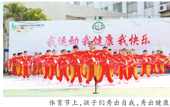
体育节上,孩子们秀出自我,秀出健康