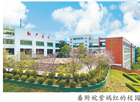
番附蜿蜒嫣红的校园