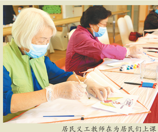
居民义工教师在为居民们上课

9月10日教师节,泰康之家·粤园举行乐泰学院秋季开学典礼。致敬为人类传道授业解惑分享知识的人们,也为“活到老学到老”的长者们,开启新一季的“人生乐活课”。