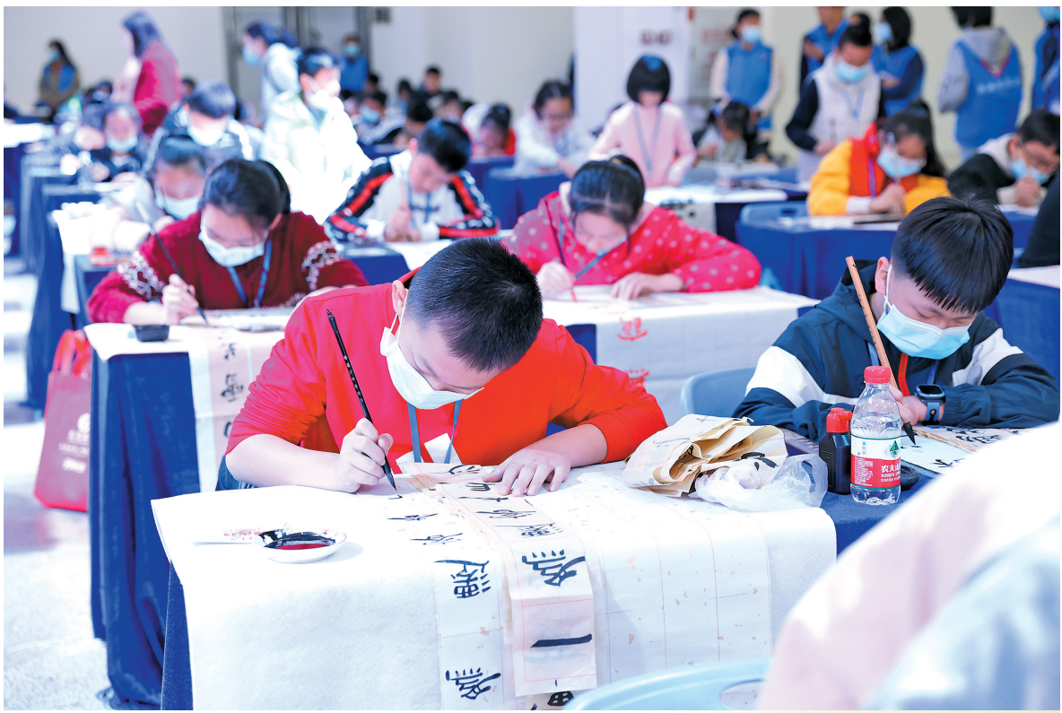
第二届“东莞银行杯”书法比赛决赛现场