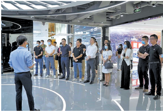
与会人员参观鲲鹏产业源头创新中心

会议当天,百余位科技创新企业代表、行业专家互动交流不断,自由讨论环节还有代表频频提问,现场氛围热烈。活动主办方表示,今后希望通过更多维度深层次的深珠交流活动,加强深珠企业深度合作,也希望各方企业与华发产业园一道共创产业生态、集聚创新资源,撬动数字产业升级发展。(文/图 何叶舟)