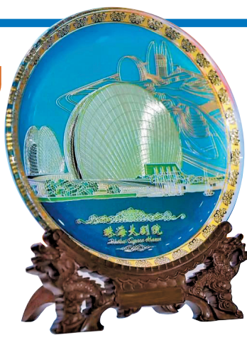
丰富的文旅产品展示,吸引市民前来打卡

2021广东旅博会期间,省文化和旅游厅举办了“广东文旅消费季”惠民补贴活动,珠海参展企业也积极参与其中。港中旅(珠海)海泉湾有限