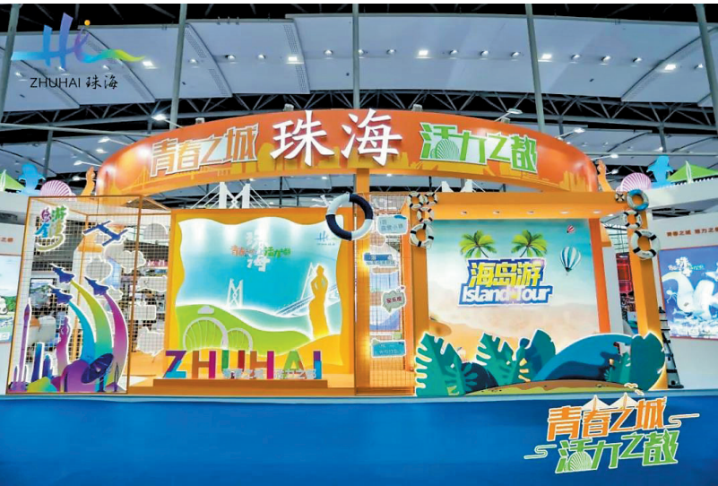
珠海亮相2021广东旅博会

日前,2021广东国际旅游产业博览会(以下简称“广东旅博会”)在广州中国进出口商品交易会商品展馆A区举行,以“青春之城 活力之都”为主题精心打造的珠海展馆惊艳亮相,珠海市文化广电旅游体育局率各区文旅部门以及多家文旅企业代表逾百人参展。