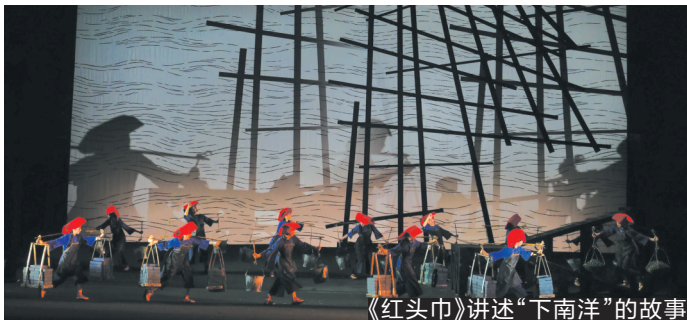
《红头巾》讲述“下南洋”的故事

“下南洋”与“闯关东”“走西口”,被并称为近代中国的三次移民潮。该剧讲述的就是其中“下南洋”的故事。该剧由国家一级导演,中国戏剧梅花奖表演艺术家、国务院特殊津贴专家张曼君执导;国家一级演员,文华表演奖、中国戏剧梅花奖获得者曾小敏主演。描述的是上世纪30年代初,灾荒年间,三水女人卢带好、阿月和阿丽姐妹结伴去南洋当红头巾谋生养家的旧时往事。她们离乡别井在新加坡从事苦累的建筑行业,戴上“红头巾”,默默地承担命运多舛的所有苦难和悲欢离合。红头巾们不屈服于