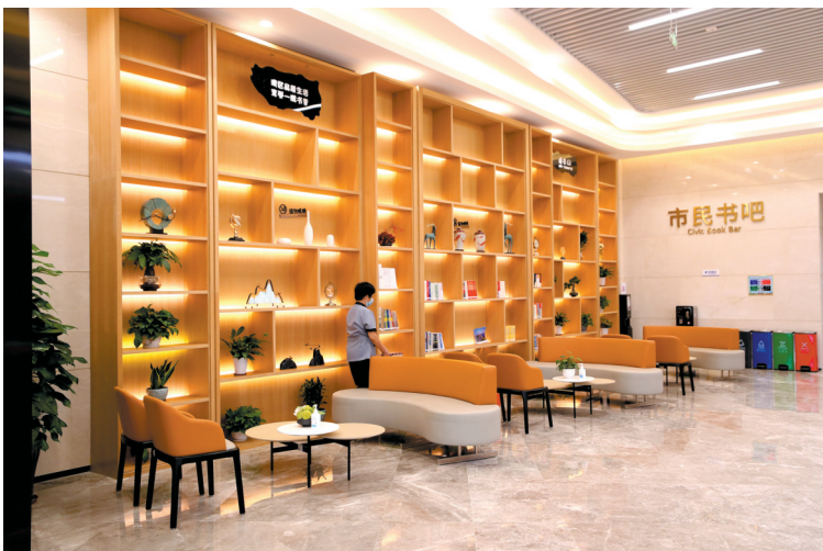
服务中心内的市民书吧

平日里,中心还定期组织礼仪培训、不同场景的服务流程培训,不断提升工作人员的服务能力和态度。接下来,中心还将计划组织工作人员进行急救技能培训,更好地应对各种突发事件。