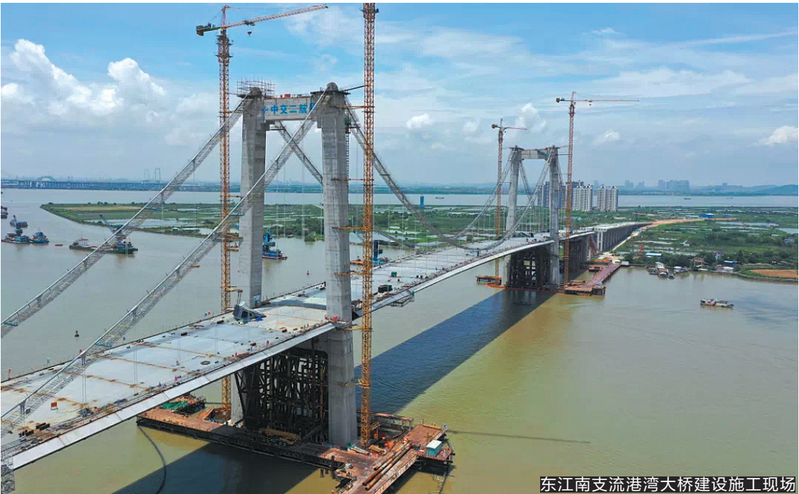
东江南支流港湾大桥建设施工现场

羊城晚报讯 记者余晓玲、通讯员沙田摄影报道:备受关注的东莞东江南支流港湾大桥的工程建设取得新突破。近日,经过两天紧张施工,该桥实现了地锚到自锚体系的转换,克服了技术难度大、安全风险高的施工