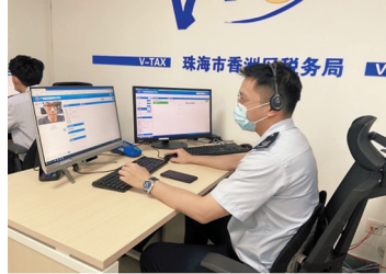
税务人员通过V-Tax平台为纳税人提供远程帮办服务

据了解,珠海税务部门在市、区两级设立的集约化处理中心,共安排98人处理4类215项线上涉税涉费业务。5月份正式运行以来,线上事项申请平均办理时间由6.72小时缩短至0.96小时,连续4个月响应效率居全省第一。集约化处理在提高线上办税便捷度的同时也极大增强了纳税人“非接触式”办税意愿,全市网报率持续稳定在99.9%以上,5-8月网报率蝉联全省第一。