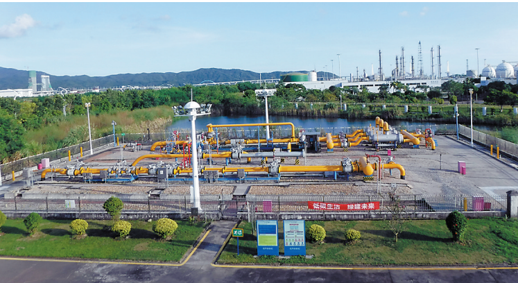
珠海管道横琴首站

羊城晚报讯 记者郑达、通讯员厉珊报道:羊城晚报记者从中国海油气电集团旗下中海石油珠海管道天然气有限责任公司(以下简称“珠海管道”)获悉,截至9月12日,珠海管道为澳门特别行政区累计输送天然气首次突破10亿立方米,其中,2021年输气4687万立方米,为澳门经济社会发展提供了稳定的清洁能源保障。