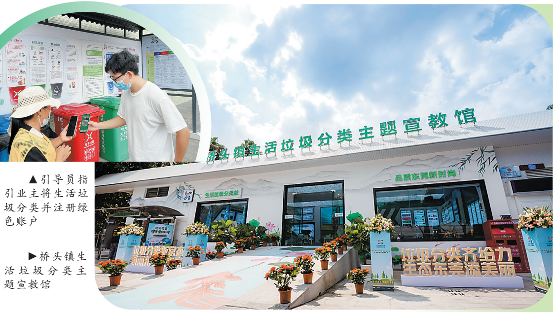
▲引导员指引业主将生活垃圾分类并注册绿色账户

作为一家“垃圾分类+互联网”的专业服务商,东莞花香郁兰科技有限公司(以下简称花香郁兰)不仅为茶山镇带来了最先进的垃圾分类理念,还用科技手段解决了生活垃圾分类的多个痛点、难点,同时开展全方位宣传工作,让生活垃圾分类走进人们的生活。正是因为有茶山的成功经验,花香郁兰正以势如破竹的攻势进驻到东莞其他镇街,合作服务的镇街包括大岭山、松山湖、桥头、中堂等地。花香郁兰根据每个镇街不同的情况量身定制服务方案,积极为东莞生活垃圾分类新风尚添砖加瓦,力争做好东莞生活垃圾分类智能“大管家”。