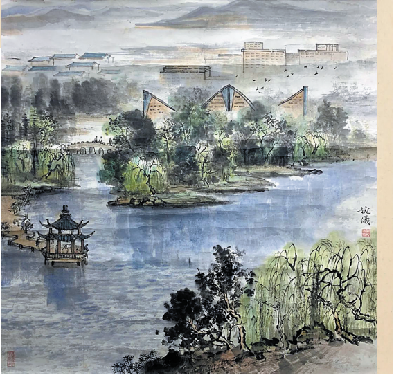
参展作品《松湖春韵》

据悉,本次展览展至10月31日,主办方希望通过艺术的形式,引导广大群众特别是青少年树立坚定的理想信念,用脚踏实地的切实行动为祖国的繁荣强大添砖加瓦,为实现中华民族伟大复兴的中国梦而奋斗拼搏。