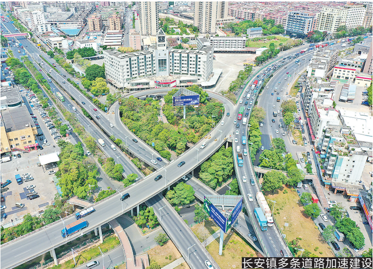
长安镇多条道路加速建设

今年年初,长安镇将横安路改为单向行驶车道,还对东门中路万达广场路段、莲湖路森林公园路口、横中路与新岗路路口、横增路与西安路路口、横增路-横安路-横诚路相交路口拥堵节点进行改造。一系列的改造让交通更畅顺,市民出行更舒心。 城市建设,交通先行。过去五年,长安镇统筹推进城市规划建设管理工作,深入贯彻乡村振兴战略,实施城市品质三年提升计划,打造了高品质的城市环境,特别是多项重点交通基础设施项目的加速推进,为长安镇高质量发展提供交通支撑。