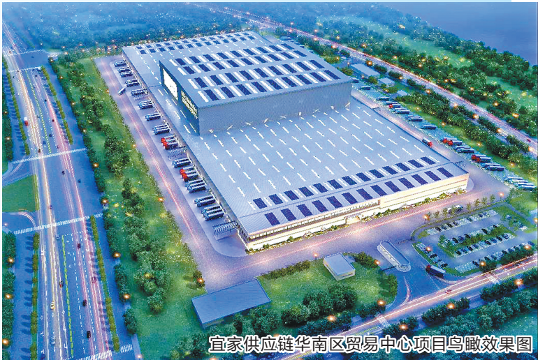
宜家供应链华南区贸易中心项目鸟瞰效果图

羊城晚报讯 记者梁正杰、通讯员杜广辉报道：10月20日上午，位于佛山市高明区杨和镇杨西大道北，宜家供应链华南区分拨中心项目正式动工。该项目总投资10亿元，占地面积240亩，这将加快高明现代智能绿色物流、绿色低碳循环发展进入快车道。