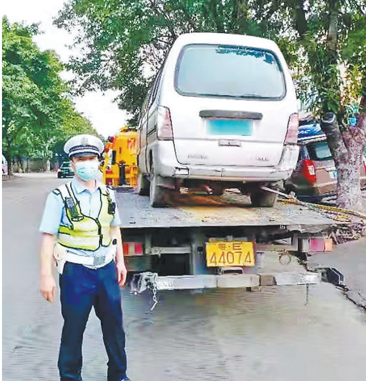
禅城警方正在拖走一辆“僵尸车”