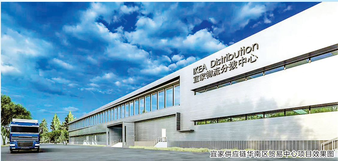
宜家供应链华南区贸易中心项目效果图