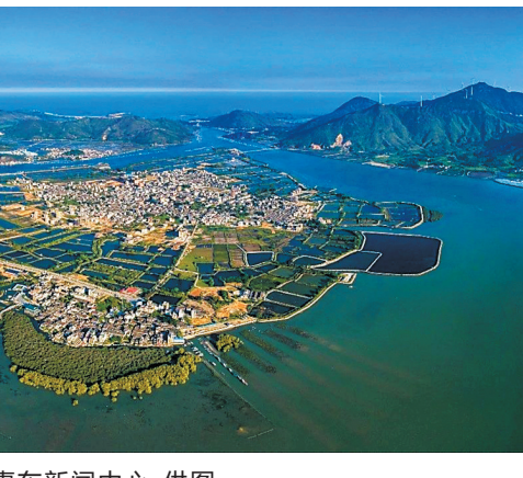
盐洲岛鸟瞰图

综上所述，碧甲栅所在稔山范和、芙蓉、长排、大墩等盐业村落陈氏大族，利用王朝鼎革时机，通过户籍登记等手段，获得对盐田的合法所有权。同时通过入籍本地同姓大族，取得合法居住权，并联合他姓合力开垦大围，从而奠定地方大族的地位。手段各异，但都实现了对富饶的渔盐资源控制和垄断，成为富甲一方的大漏主。稔山碧甲栅的陈氏呈现不同于平海淡水场的历史过程。