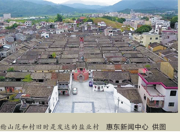
稔山范和村旧时发达的盐业村

大亚湾盐场盐栅所在村落，有着多元的历史过程。碧甲栅所在的稔山镇范和村、长排村，其中范和村大姓陈氏祖于明后期初来此定居，随即开垦盐田，成为碧甲栅最大的漏主。长排村陈氏于明后期始迁入，通过范和村陈氏的州县户籍登记获得合法身份，以及清初联合村内他姓修建大围等策略，也成为拥有碧甲栅盐田的大漏主。大洲场以大洲岛为中心，明后期渔民陆续上岸拓殖盐田，建立起大洲岛盐业村落，天后崇拜等民间信仰整合了岛上的盐业村落，使得岛内村落之间势力均力，呈现了与淡水场、碧甲栅并不一致的盐业社会扩张过程。