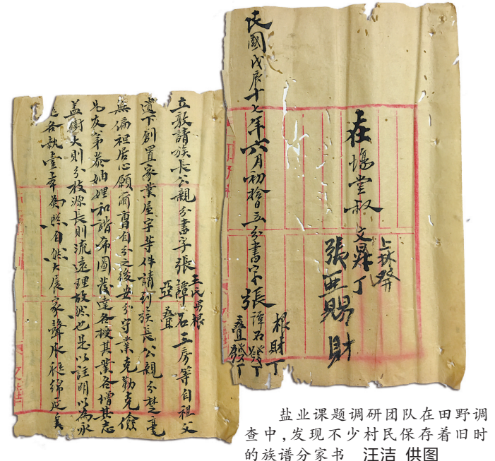
盐业课题调研团队在田野调查中，发现不少村民保存着旧时的族谱分家书

业课题调研报告，并结合文献史料、实地走访等方式，追溯旧时盐场(栅)所在盐业村落的社会形态变迁，阐述明清时期淡水场盐业扩张对沿海村落社会形态演变的重大影响。(陈丽媛)