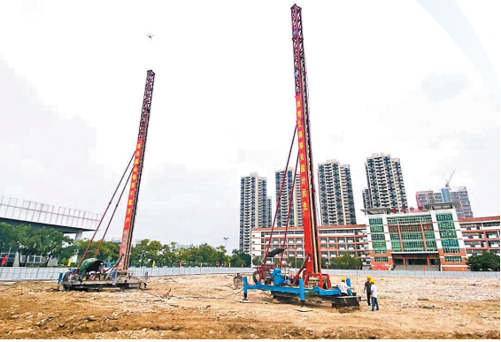
樵北中学扩建工程动工

11月3日，南海西樵樵北中学扩建工程正式动工，这是构建“西樵教育地图”的一项重要举措。该工程按照2430个学位进行设计，将大大缓解西樵镇新城区优质学位紧张的问题。同日，南海石门实验小学新建建筑面积达1.4万多平方米的综合楼已顺利封顶，综合楼建成后，将为学校教育教学改革、特色建设提供更充足的硬件支撑、更广阔的发展空间。