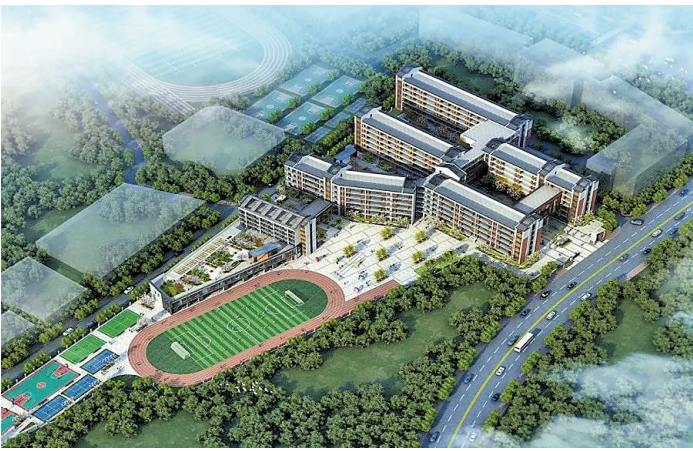
樵北中学扩建工程效果图

今年9月，石门实验小学迎来首批近400人的初一新生，开启了该校小学、初中九年一贯制办学模式，既满足了广大家长对优质教育一体化的需求，也开启了该校教育改革的新征程。