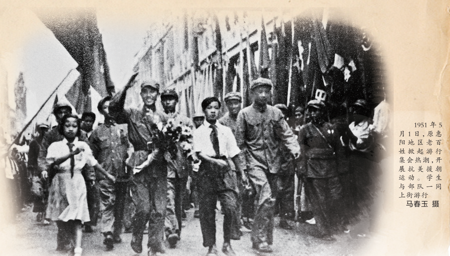
1951年5月1日，原惠阳地区老百姓掀起游行集会热潮，开展抗美援朝运动。学生与部队一同上街游行

在中国人民志愿军入朝作战的同时，全国上下掀起了波澜壮阔的抗美援朝运动。今天，让我们走进惠州老兵的记忆，透过散去的硝烟，一同去感受那段炮火纷飞的峥嵘岁月，铭记这些“最可爱的人”。