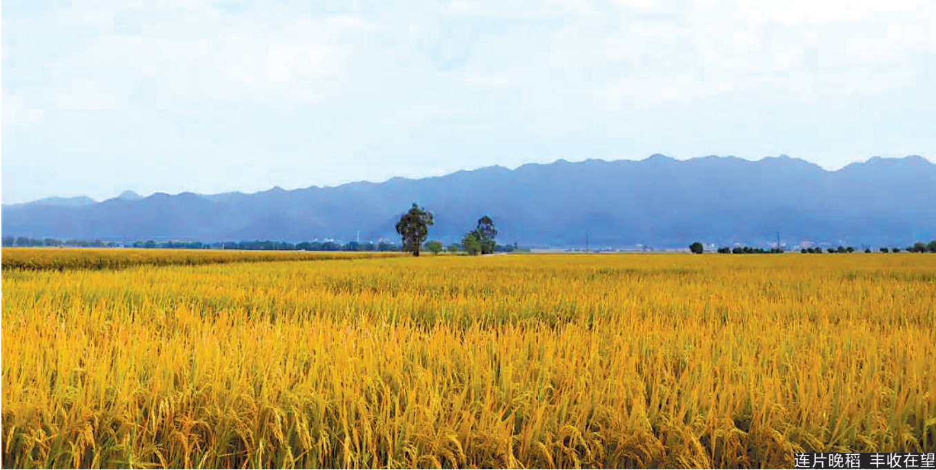
连片晚稻 丰收在望