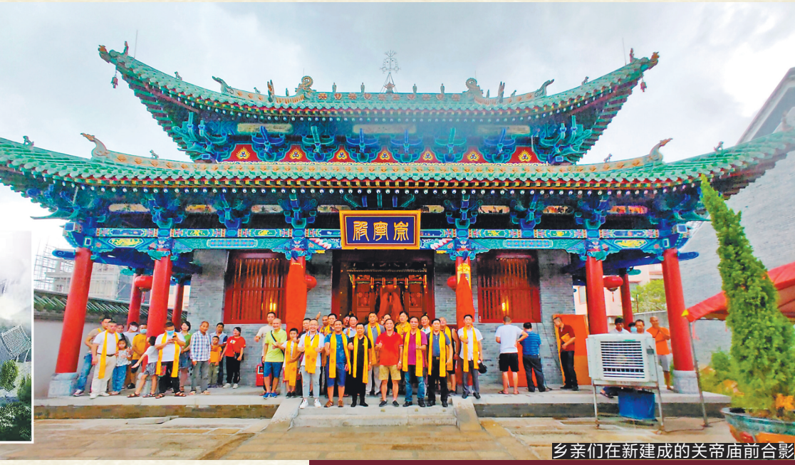
乡亲们在新建成的关帝庙前合影

2019年9月10日九江关帝庙奠基，建筑为完全按古法的木构架结构体系，结构严谨而精巧。该建筑物斗拱用以承托梁头、枋头，也用于构架的节点上，还用于外檐支撑出檐的重量，而出檐的深度越广，斗拱的层数也越多。在古建筑中，斗拱具有结构和装饰的双重作用，古时以斗拱层数的多少来表示建筑物等级的标准。建筑属中国古建筑中的最高形制——庑殿，这种建筑形式常用于宫殿、坛庙一类的皇家建筑，这种特殊地位决定了它用材硕大，体量雄伟，装饰华贵富丽，具有较高的文化价值和艺术价值。