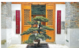
袁庚祖居内厅古色古香

教育基地的打造仅靠办事处和社区的力量难以完成。为此，大鹏办事处采取共建共治共享模式，形成了街道党工委、社区党委、集体经济、辖区居民与企业共同参与的新路径，并争取到招