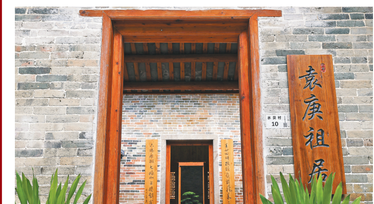
祖居大门修葺一新

沿着大鹏的葵南路向南前行，跨过王母河，穿过刻有“水能育万物物华天宝 贝可富诸人人杰地灵”水贝村牌坊，沿王母河旁的绿道前行百余米，便可见一条笔直的大道横于眼前，它便是今年才启用的睿鹏大道。隔着大道便能看到红花绿叶映衬下，一片青砖黛瓦的岭南建筑群错落有致地坐落於群山之下，它便是大鹏新区大鹏办事处布新社区水贝居民小组，村口白墙上，“广东省历史文化游径：水贝袁庚祖居”的地名牌十分醒目。