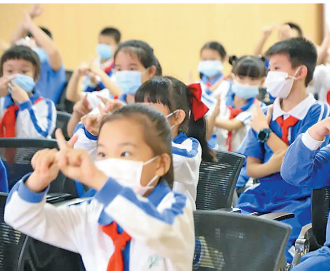
学生们纷纷举起小手彰显信心

此次活动共派发宣传资料300余份，切实提高了居民寄递安全意识，力争做到堵源截流，减少寄递贩毒案件发生。（胡振华 彭小玲）