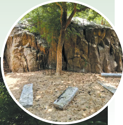
凤凰山古道

羊城晚报讯 记者钱瑜、文艺报道：为深入挖掘南粤古驿道文化内涵、提升古驿道利用效能和体验品质，珠海市自然资源局、珠海市香洲区政府联合广东省规划师建筑师工程师志愿者协会发起了珠海香山古道（凤凰山段）“大师小筑”景观节点公益设计方案征集大赛，计划于凤凰山古道上打造四处景观精品。活动共形成32份设计方案，现正式开启网络投票。