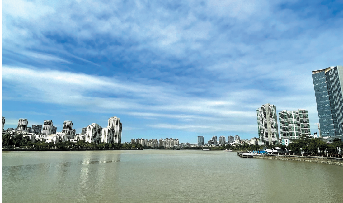
前山河流域高质量滨水经济带展现雏形

目前，经过两轮的综合治理，前山河水环境质量得到改善。2021年1—9月，平均水质达到地表水Ⅲ类标准，流域内5条城市黑臭水体全部通过住建部“长制久清”评估审核。随着流域水生态环境不断改善，水、城、产同治初见成效，高质量滨水经济带展现雏形。