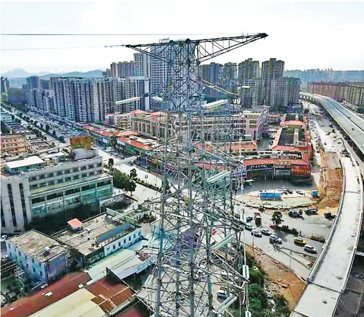
两座高压线塔大大影响坦洲快线的建设进度

此外，220kv桂宝甲乙线、桂乐甲乙线横穿三乡9.01公里，沿线厂企、商圈、住宅小区较多，全部拆除之后将为未来发展释放城镇空间和景观视廊。