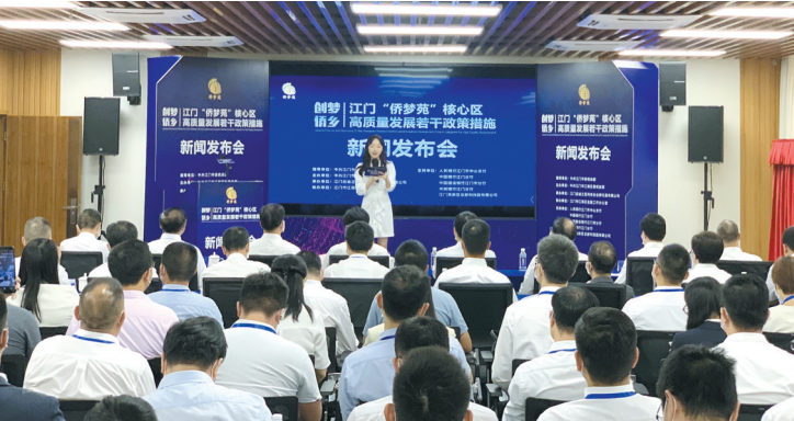
相关部门召开新闻发布会解读“侨梦苑”核心区专项优惠政策

记者近日采访时了解到，作为江门华侨华人创新创业的重要平台，中国（江门）“侨梦苑”华侨华人创新产业聚集区将迎来新一轮发展，包括核心区相关支持政策上的“加料”、“侨梦苑”新会园建设的提速等。相关负责人表示，将高水平建设“侨梦苑”，努力打造高质量的港澳台侨青年创新创业平台。