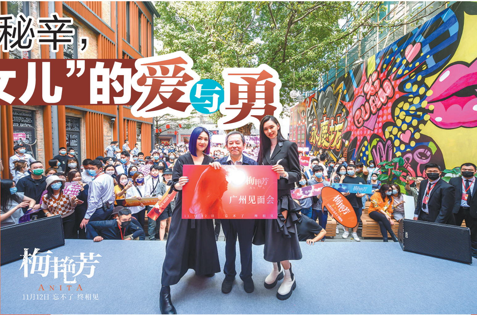
《梅艳芳》团队走进永庆坊

11月8日，第18届广州大学生电影展在广东艺术剧院开幕。开幕影片《梅艳芳》的监制江志强、主演王丹妮和杨千嬅亲临现场，导演梁乐民、演员古天乐和林家栋则以连线方式惊喜亮相，与现场观众沟通交流。 从10月底开始，《梅艳芳》剧组开启了内地的宣传行程，短短一周就跑遍广州、上海、杭州、武汉、成都、深圳、佛山等多个城市。面对如此密集的行程，70岁的江志强全勤出席，每一场活动从不迟到。他与一座座城市的观众面对面，接受一家家媒体的采访，一遍遍地分享《梅艳芳》的故事，力图让更多人在这部电影产生兴趣。 《梅艳芳》讲述了一代天后梅艳芳的传奇一生。传记片不好拍，也不容易卖座，《梅艳芳》自筹拍以来便面临着许多不看好甚至质疑的声音。此前接受广州媒体采访时，江志强形容《梅艳芳》是“一个电影人的感情用事”。江志强用这部电影来兑现他对梅艳芳的承诺，“我现在终于可以和梅姐讲一声，‘梅姐，我说话算数’。”