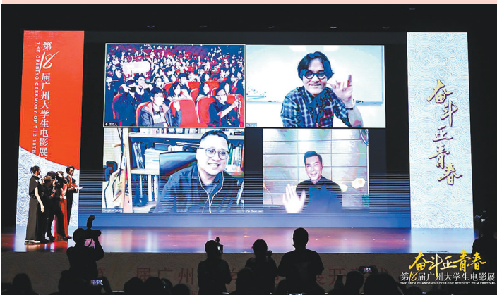
导演梁乐民、演员古天乐和林家栋连线大影展

11月8日，第十八届广州大学生电影展开幕式（以下简称“大影展”）暨“首映在广州”《梅艳芳》首映礼在广东艺术剧院盛大开幕。今年，大影展迎来了18周岁成年礼，本届大影展以“奋斗正青春”为主题，由青年演员朱正廷担任形象大使。同时，开幕影片《梅艳芳》主创团队监制江志强，演员杨千嬅、王丹妮等也到场支持。