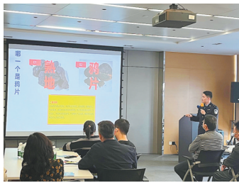
禁毒大讲堂活动现场

11月8日,由龙华区观湖街道禁毒委员会主办、深圳市司法局第一强制隔离戒毒所协办的“每月8日和毒品说88”第七期禁毒大讲堂活动走进观湖街道高新园区企业,为园区内近50名员工开展禁毒专题宣讲。