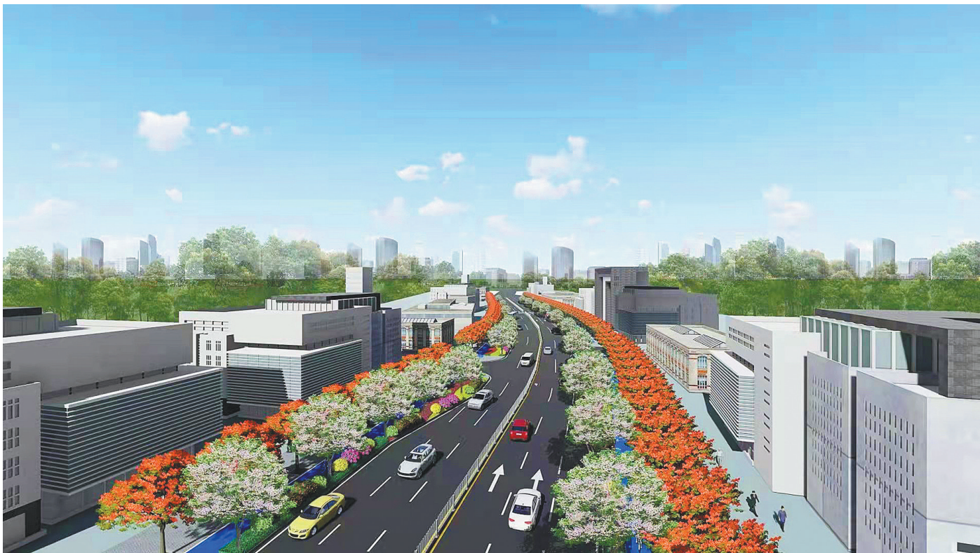
风景南路项目效果图

11月11日,光明区区级重点项目风景南路(松白路—通兴路)市政工程复工仪式,在马田街道合水口社区正式启动。马田街道按照最新标准要求,对该路段有序开展好基础设施完善、道路景观提升等系列建设工作,用实际行动推动光明区城市交通网络高质量高颜值发展。