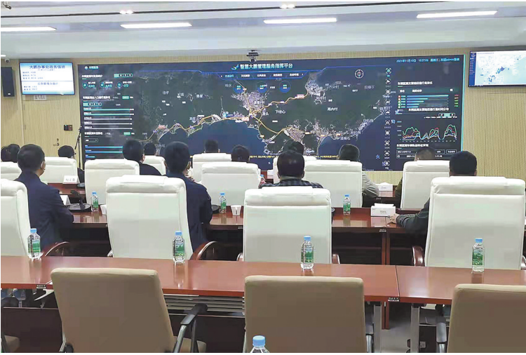
大鹏分中心拥有4K分辨率宽幅大屏

“利用三级联动体系,在指挥分中心就能快速了解全区道路交通、生态环境等多方面的问题,大大提高了信息的准确度,极大加快了突发事件的人员调配和处置速度……”11月10日,随着大鹏新区管理服务指挥中心大鹏分中心的启用,标志着大鹏新区完成全区三级联动体系覆盖,同时成为深圳市首个全区建成“市——区——办事处”三级联动体系的片区。