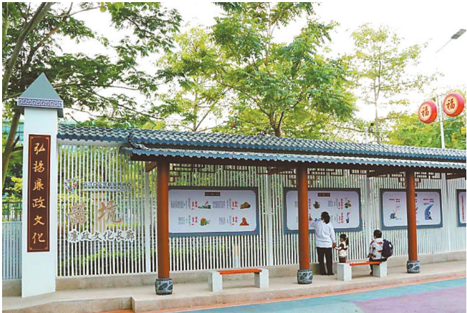
福城廉政文化诠释“福”字新理念

“寻根是人们认祖追宗寻祖溯源的传统习俗,更是中国人寻觅共同民族之根的文化传承。”在龙华区的福城街道,以清廉正直的家世家风故事,提醒着后辈崇尚祖训,“家风正,民风淳,政风清”的主题的社区廉政宣教阵地随处可见。