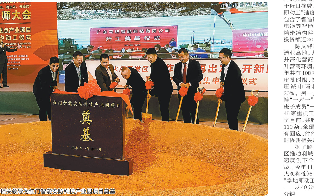
相关领导为红门智能安防科技产业园项目奠基

文/图 羊城晚报记者 林翎 通讯员 姚偷玉 肖晨茜 11月11日上午,中山火炬开发区“转作风、再出发、开新局”重点产业项目集中动工仪式在民众街道多宝社区浪源路红门项目地块举行,五个于近日摘牌、持续刷新中山“拿地即动工”速度纪录的项目集中动工,另有12个重大项目集中签约。 中山市委书记郭文海,广东省委党史学习教育第三巡回指导组组长陈杭,中山市委副书记、市长肖展欣,中山市委副书记、火炬开发区党工委工委书记陈文锋,中山市委常委、秘书长李长春等人出席活动并为动工仪式启动推杆。