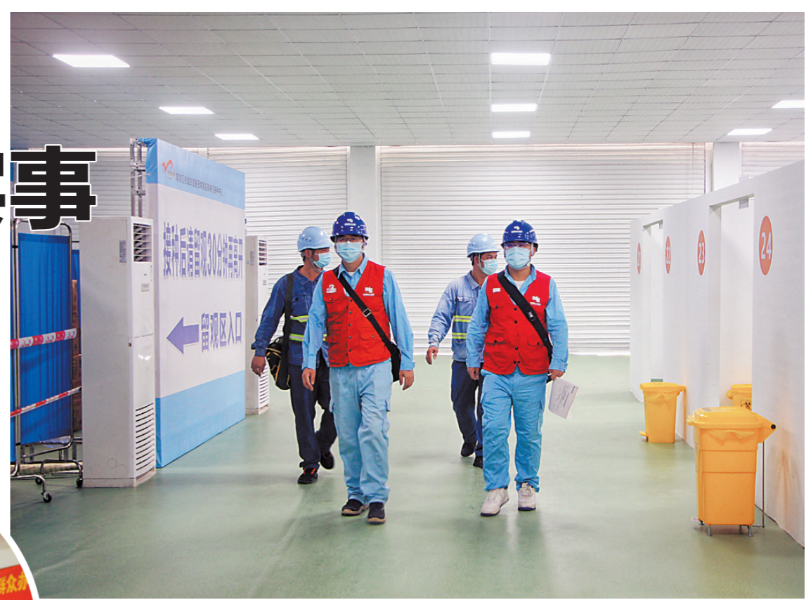
2021年6月15日，佛山南海供电局桂城供电所保障疫苗接种中心用电