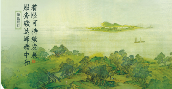
着眼碳达峰碳中和

截至2021年6月末，兴业银行佛山分行绿色融资余额近200亿元，其绿色融资业务遍布绿色建筑、城市轨道交通、天然气利用、垃圾焚烧发电、先进环保装备制造等领域。