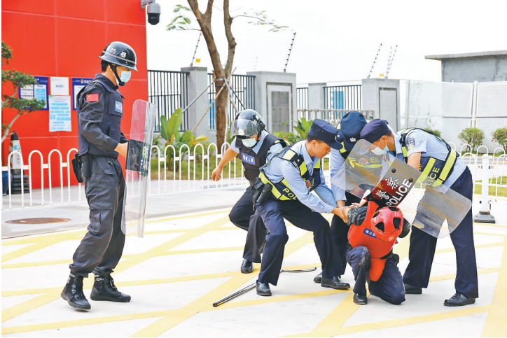
在平沙镇汇华四季小学开展处置突发事件的应急演练

演练过程中,一名男子趁学校放学期间,手持刀具不顾值班保安的劝阻,企图强行闯入校园。正在值勤的警戒员发现后,