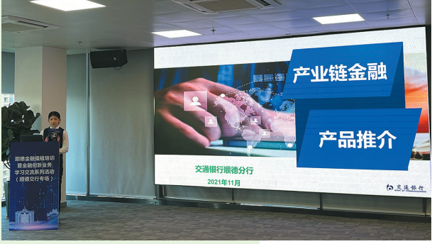
产业链金融产品推介

交通银行顺德分行积极贯彻落实党中央关于深化金融体制改革、大力发展普惠金融的要求,以服务实体经济为核心,不断加大对本土中小企业的金融辐射力度。交通银行顺德分行坚持开辟金融服务线上绿色通道,持续支持稳企业、保就业,发展产业链金融,全力提供高效、便捷、安全的金融服务。