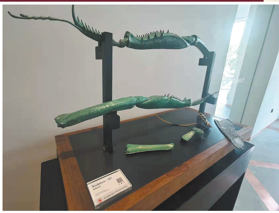
用铜制作的螳螂腿