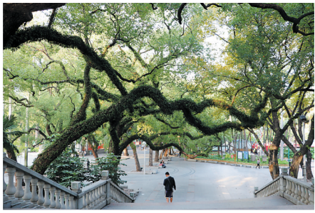
中山公园里的古老香樟树