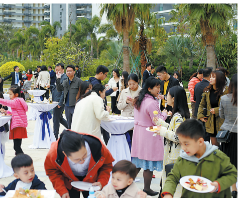
平日假期里,周边的游客会带上自己的孩子到惠州游玩

值得关注的是,建在乡村的新型公共文化空间,在满足乡村精神文明需求的同时,也成为当地特色文化展示的窗口,有些还成了当地乡村旅游中的“亮点”。在此契机下,惠州如何利用好公共文化空间,讲好惠州文化故事?