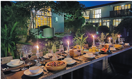
在惠州民宿中,游客可以享受充满乡村味的烛光晚餐

华南理工大学广东旅游战略与政策研究中心主任吴志才认为,惠州搭建公共文化空间时,可考虑在满足群众精神文化生活需求基础上,结合当地的特色,以之融入其中,作为精神文化展示窗口。