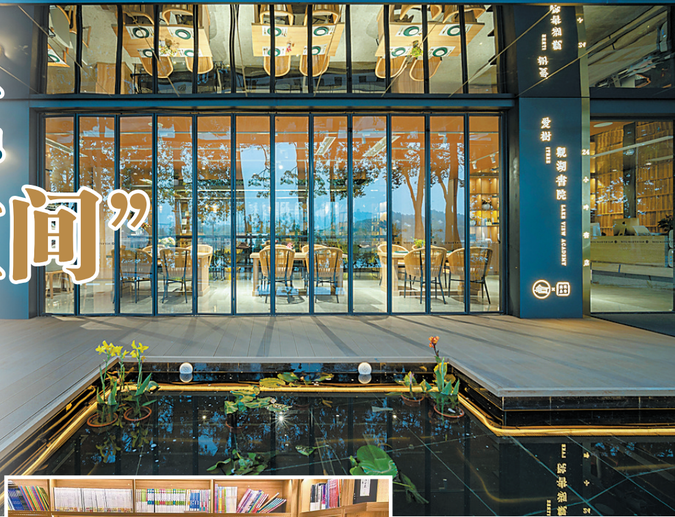
观湖书院立于西湖边,一楼为书吧