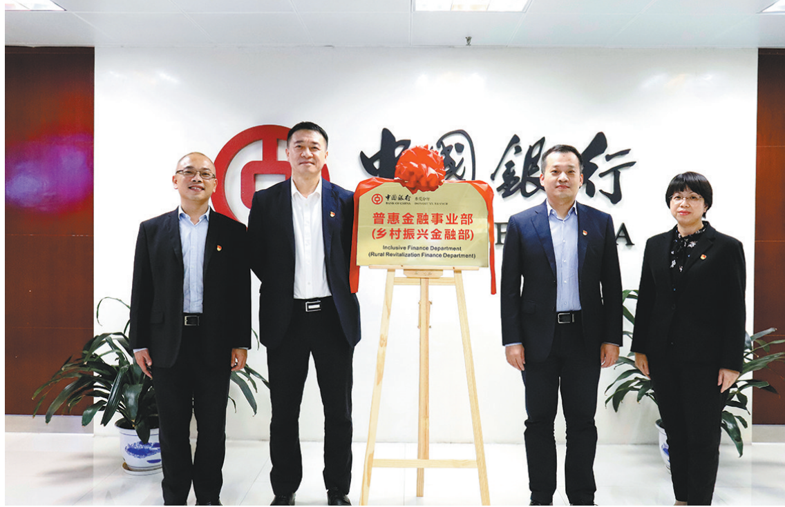
东莞中行成立普惠金融事业部(乡村振兴金融部)

作为以农为本、助农振兴的三农金融主力军,东莞农商银行结合东莞经济发展实际,围绕村组经济积极打造新时代三农金融服务新模式。今年以来,东莞农商银行在东莞率先成立乡村振兴金融服务中心,并推出乡村振兴金融服务“133”工程,围绕乡村振兴战略目标,全力做好促进农业高效、促进乡村宜居