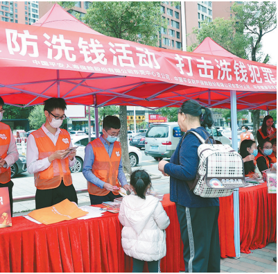
东莞平安产险开展“2021年度反洗钱宣传”进社区活动

在今后的工作中,东莞平安产险还将持续推进反洗钱宣传工作,充分发挥自身在维护社会安全、防范金融风险及遏制和打击违法犯罪方面的重要作用,帮助广大民众树立法律意识,远离洗钱犯罪。