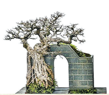
吴松恩作品:《南国春早》