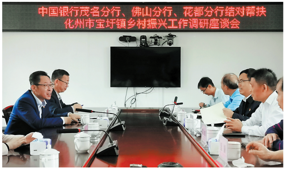
中国银行茂名分行、佛山分行、花都分行结对帮扶化州市宝圩镇乡村振兴工作调研座谈会

金融是经济社会发展的血液,乡村振兴战略的推进离不开金融的助力。中国银行佛山分行(以下简称“佛山中行”)提高政治站位,发挥行业优势,将金融服务转型与履行社会责任紧密结合起来,以普惠金融赋能特色产业发展,为乡村振兴帮扶注入金融活水,走出乡村振兴的“中行实践”。