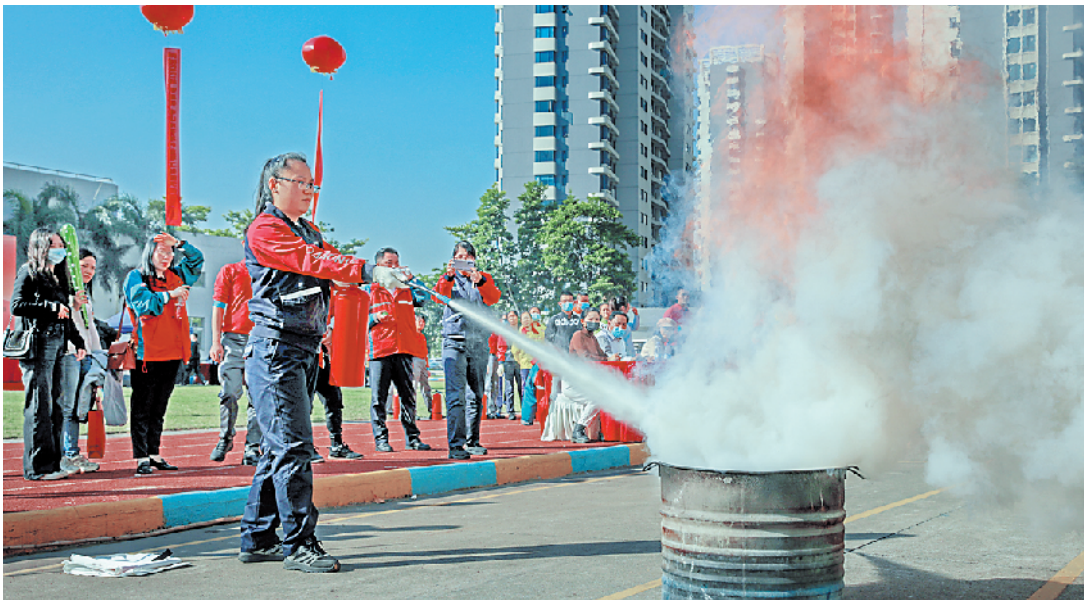
大赛现场

羊城晚报 记者林翎、通讯员田花报道：11月25日上午，2021年中山市“安康杯”石油行业职工劳动技能大赛在中山市消防救援支队康安路特勤站拉开帷幕，来自中国石化、中国石油等10家单位87名技能人才同台竞技，在灭火器灭火、灭火毯灭火、卸油跑冒油综合应急演练处置三个消防技能竞赛项目中展开激烈角逐。