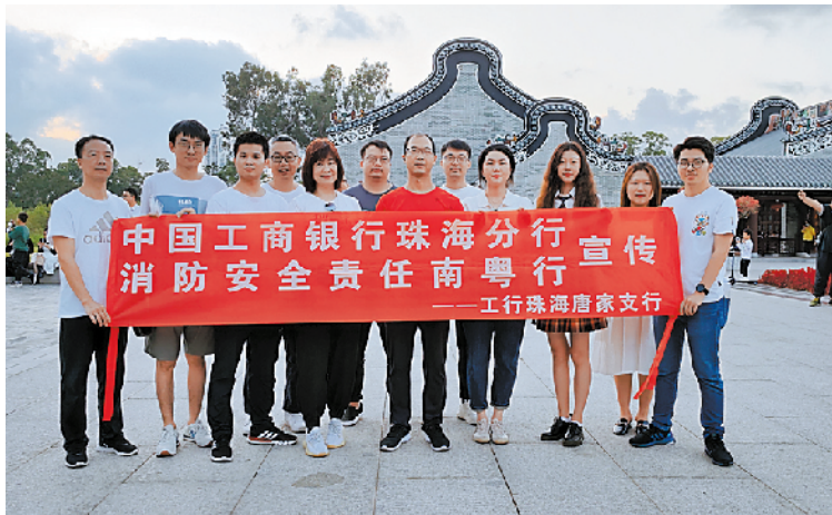
工商银行唐家支行走进园区开展消防安全宣传活动