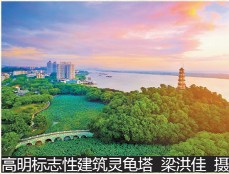
高明标志性建筑灵龟塔

阮涌区氏家族崛起于明中叶高明立县之后。明朝初年，隶属高要县的高明地区盗寇严重。至明成化年间，高明立县，社会环境相对安稳。与此同时，一批南海籍士人通过科举考试步入仕途，形成“南海士大夫集团”。