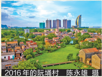
2016年的阮涌村