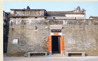
2017年的阮涌村村史馆

路向南，无论是自然景观还是人文风情，都被他一记录下来，这些素材成为后人宝贵的文化资源库，“这也启发我们可以在日常生活中保持学习的状态，从历史中汲取正能量。”