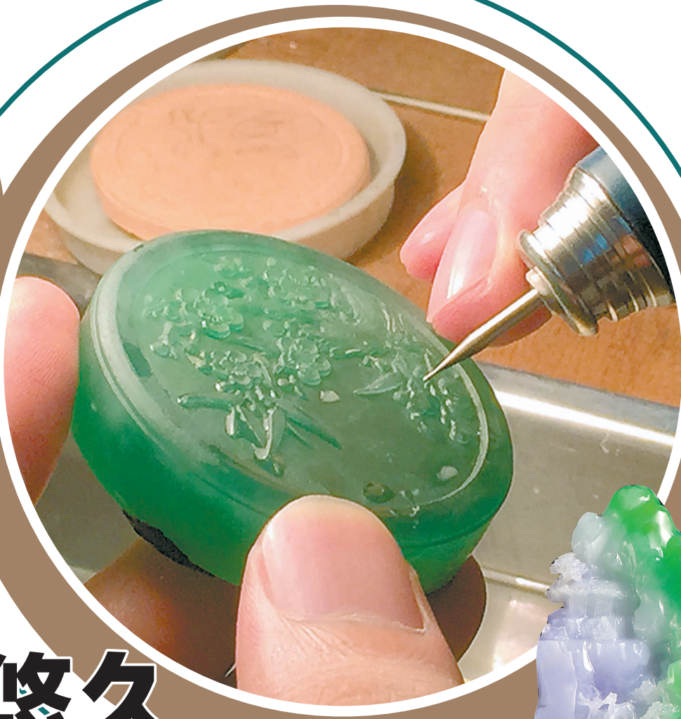
文图 羊城晚报记者 赵映光 王沫依

11月26日至28日，以“创新玉都，‘玉’见未来”为主题的第二十届中国（揭阳）玉文化节在阳美村举行，集中展现近年来揭阳市玉文化产业创新发展与玉雕人才培养的成果。这场一年一度的玉文化产业盛会，也再次将世界各地的目光吸引到了揭阳这座因玉闻名的古老而又年轻的城市。