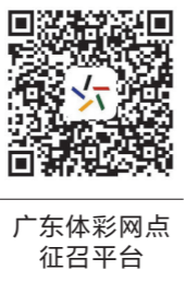
广东体彩网点 征召平台

12月11日,超级大乐透第21142期开出6注一等奖,其中2注1000万元基本头奖落入广东深圳,由一幸运儿以4元单注号码2倍投注命中。