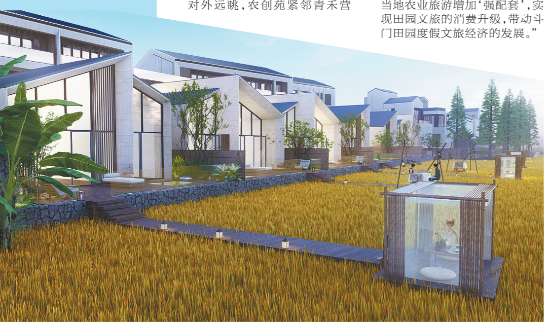
推门见稻田的酒店将在斗门建成(效果图)