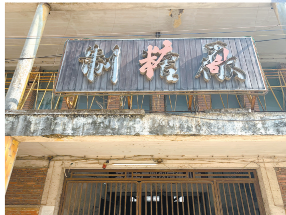
厂房内特色的制糖厂牌匾