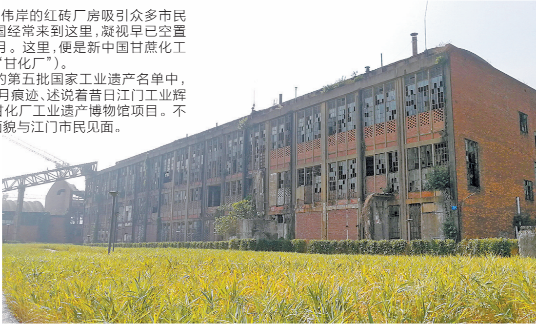
甘化厂内的制糖厂车间

江门是珠三角老牌工业基地，而甘化厂则是当年江门的“活招牌”。作为上世纪辉煌时代的见证，不少江门人都希望尽可能保存这段公共记忆。近日，一段1979年上映的电影《甜蜜的事业》片段在江门社交媒体圈中获得大量关注。这段影片便是在当年的甘化厂中取景，电影中的不少情节都取材于甘化厂。 不少江门历史研究者表示，这段视频的传播反映了江门人对甘化厂仍有深厚的感情。五邑大学广东侨乡文化研究中心副教授谭金花认为，甘化厂是江门的城市名片，政府应做好规划，擦亮文化品牌。 记者了解到，2013年，江门市政府通过了《江门市甘化厂工业遗产保护方案》，划定了1.23万平方米的保护范围，保留糖厂主厂房（制糖车间）及仓库作为历史建筑，保留货运码头，对109台（套）生产设备实施原址保留。从2014年至今，江门市财政每年划拨50万元专项资金用于甘化厂工业遗产日常保护管理工作，加强对甘化厂工业遗产文物的安全保护，对工业遗产制糖车间厂房和设备开展保管维护，包括设置专业安防设施和聘请专门保安进行值守，对工业遗产周边环境进行维护等。 今年，甘化厂工业遗产博物馆项目被列入江门市城市品质提升行动重要节点项目计划（2021—2025）。江门市工信局有关负责人表示，接下来，江门市计划调拨资金启动甘化厂工业遗产博物馆项目，“希望通过做好甘化厂的保护工作，让更多年轻一代了解其中的‘奋进故事’，并激励更多的江门奋斗者，在这片热土上创造出更大辉煌。”