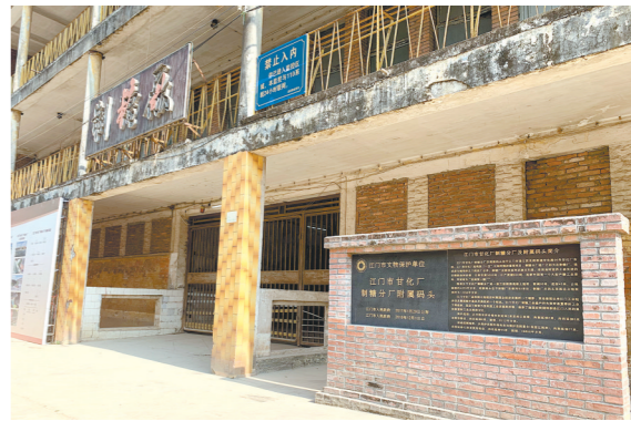
甘化厂内的文保单位标志

2021年12月15日 星期三 湾区新闻部主编 责编 黄铁安 / 美编 郭子君 / 校对 何绮云