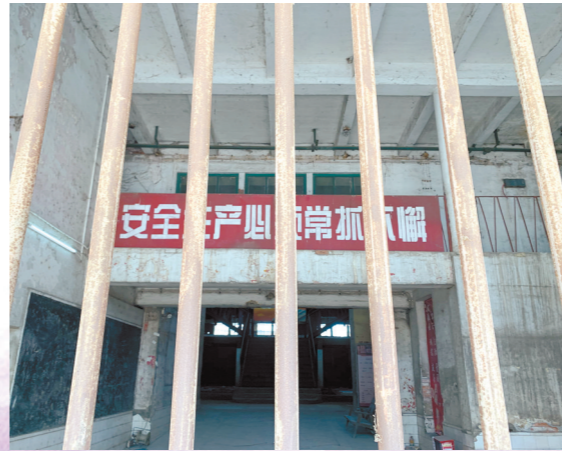
空置的厂房内仍挂着安全生产宣传标语

甘化厂建成至今已有60多年，但其厂房仍不失气势。摄影发烧友周先生就经常过去采风：“那里的景象很上镜！”记者了解到，甘化厂建于1950年代，当时的社会主义兄弟国家曾参与设计，因此厂外观带有浓重的年代感。 据甘化厂工业遗产申报资料记载，甘化厂厂房依照承重框架的划分为纵向三段以及纵向多段；厂房采用大面积开窗，既化解建筑的厚重感又增加内部采光；每格玻璃窗中间自带转子可以旋转，给闷热的制糖生产线通风散热，极具现代主义建筑风格与艺术表现力，体现了工业美学与近代科学和实用主义相结合。此外，制糖生产线、桔水罐、码头、起蔗吊车、烟囱等具有强烈标示性的构筑物，体现了甘化厂工业遗产独特的滨水特征和产业风貌，又与当下流行的工业风审美不谋而合，具有较高的艺术价值。