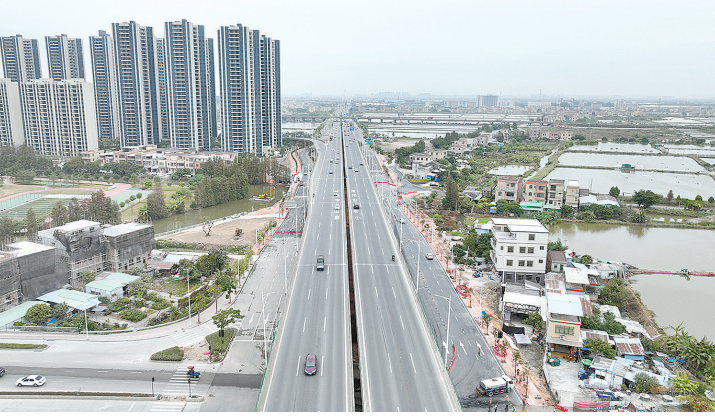
项目建成后将极大提高105国道中山段的交通承载力

羊城晚报讯 记者林翎,通讯员陈雪梅、刘嘉媚摄影报道:12月19日,随着交警部门同意中山兴塘立交跨线桥开放交通,G105线国道南段改建工程项目全线10座跨线桥主体正式迎来通车。 G105线国道南段改建工程是中山市一环西段,贯穿西南部,途经中山市西区、沙溪镇、南区、板芙镇及三乡镇五个镇街。该项目起于沙朗立交,终于三乡镇古鹤与珠海交界,全长32.3km,主要施工内容含全线6车道改8车道+非辅道,关键节点10座跨线立交及人行通道等,项目总投资12.86亿元,工期30个月,2019年12月18日动工。项目采用一级公路技术标准,兼顾城市快速路功能,全线由双向6车道改造为双向8车道。按照当前施工计划安排,接下来施工的重点将转移到两侧辅道加宽附属工程,全线预计2022年6月份通车。 据了解,项目建成后,将极大提高105国道中山段的交通承载力,有效缓解周边的交通瓶颈,并串联西区、沙溪镇、南区、板芙镇及三乡镇五个镇街,将出行时间缩短至半个小时以内,提高沿线群众的出行效率,节约时间和经济成本,也将进一步完善中山路网结构,推动经济发展。