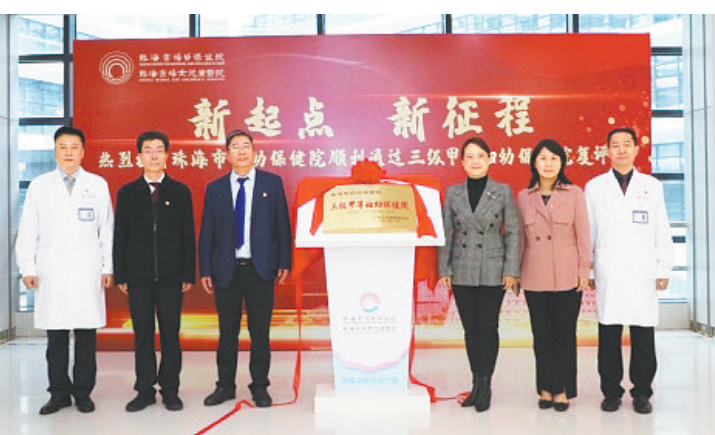
“三级甲等妇幼保健院”揭牌仪式现场

羊城晚报讯 记者郑达、通讯员钟莹莹摄影报道:近日,广东省卫生健康委正式公布了2021年三级甲等医疗机构评审结果,珠海市妇幼保健院顺利通过三级甲等复评。 12月20日,“三级甲等妇幼保健院”揭牌仪式在珠海市妇幼保健院南琴院区举行。中国工程院院士郭应春、珠海市副市长张晨、珠海市卫生健康委局长徐超龙、珠海市卫生健康委副局长黄芸出席了揭牌仪式,医院干部职工共同见证这一高光时刻。 今年10月28日,由广东省卫生健康委副主任、省中医药局局长徐庆锋、省卫生健康委员会妇幼处处长黄毓文带队的评审专家一行对珠海市妇幼保健院开展现场复核。珠海市副市长张晨、市卫生健康委副局长戴世登、刘军卫等出席了现场复核启动会。 在启动会上,徐庆锋表示,开展医院等级评价工作对深化医药卫生体制改革、提高医疗机构的医疗质量和医疗水平、推动医院管理科学化、规范化、精细化意义重大。希望珠海妇幼坚持中国妇幼卫生工作方针,把这次评审作为推动医院发展建设的新起点和加油站,统筹疫情防控与事业高质量发展,确保“十四五”健康广东建设开好局,努力续写更多辉煌。 作为珠海唯一的妇女儿童特色医院,张晨指出,珠海市妇幼保健院要乘着三甲复审的东风,努力打造为医疗技术顶尖、医疗质量过硬、医疗服务高效、医院管理