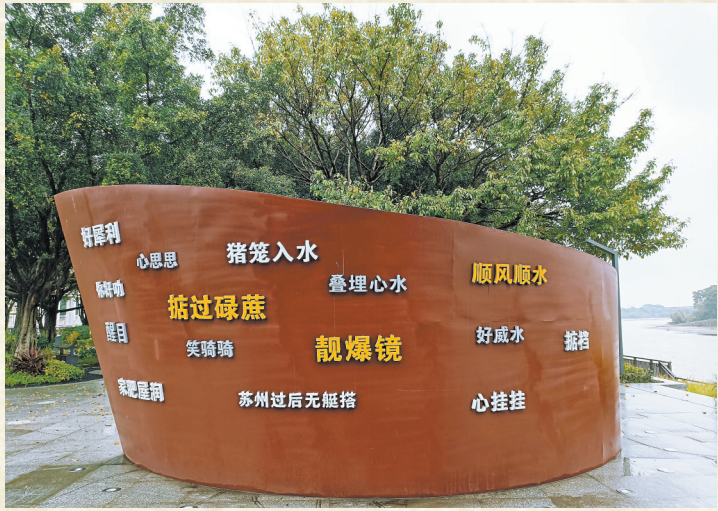
南番顺这艘“船”船头刻着三地许多相通的俚语

上世纪初，铁路取代内河水路逐渐成为广州与省内外的货运通道后，大量的佛山民族工商业采取前店后厂模式，将店设在广州、生产基地留在佛山。发展至今，逐渐形成了广州作为中心商贸城市、佛山作为手工业制造基地的局面。而如今，广佛同城的正式启动，也标志着两地的经济再度互联。