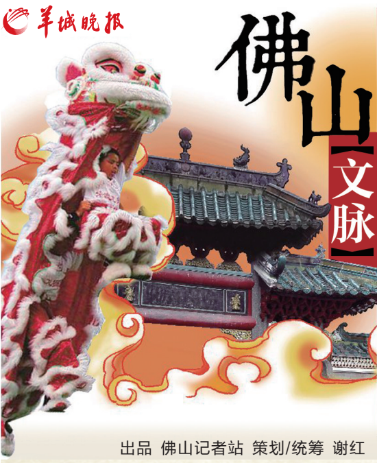
出品 佛山记者站 策划/统筹 谢红

源林投资 YUANLIN INVESTMENT 「佛山人文脉」由源林投资独家冠名 第一百五十四期