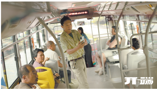
公交车是《开端》的主场景