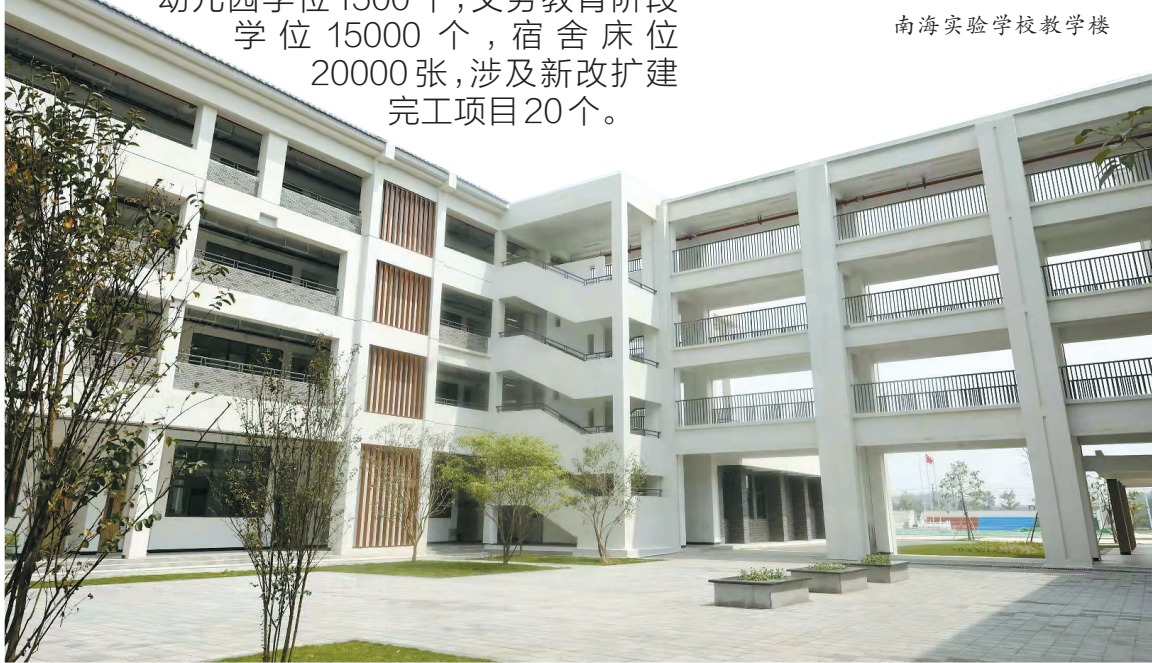
南海实验学校教学楼

今年,佛山有哪些新学校将投用?记者从佛山市教育局获悉,南海区计划完成新扩改建学校项目18个,预计可增加义务教育阶段学位超1.6万个,并将进一步筹划新建石门中学佛山西站校区,完成普通高中(中职)5个改建工程,预计增加学位1500个。顺德区计划新增幼儿园学位1500个,义务教育阶段学位15000个,宿舍床位20000张,涉及新改扩建完工项目20个。