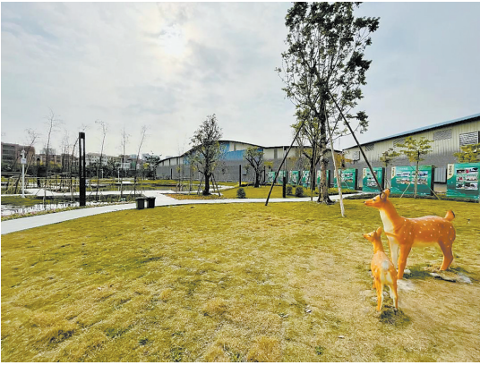
沥东社区“金花田”休闲农业公园

羊城晚报讯 记者张闻、通讯员沥宣摄影报道:2月15日,南海大沥镇“百社千园”建设项目启动仪式在沥东社区“金花田”农业休闲公园举行。