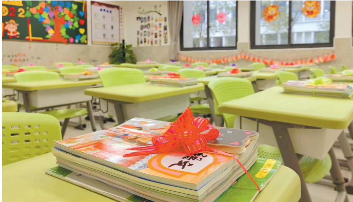
学校配套设施齐全

今年,佛山有哪些新学校将投用?记者从佛山市教育局获悉,南海区计划完成新扩改建学校项目18个,预计可增加义务教育阶段学位超1.6万个,并将进一步筹划新建石门中学佛山西站校区,完成普通高中(中职)5个改建工程,预计增加学位1500个。顺德区计划新增幼儿园学位1500个,义务教育阶段学位15000个,宿舍床位20000张,涉及新改扩建完工项目20个。