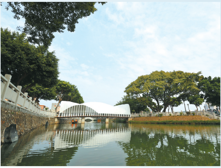
大岭丫村环卫工来回清理河道垃圾

记者在现场了解到，近年来，道滘镇坚持以“绣花”功夫做好城市精细化管理，强化环卫保洁，用心打造精品工程，高效推进环境综合治理，有效改善了全镇人居环境。其中，蔡白村以基础环境整治提升为抓手，坚定不移提升环境品质，持续开展农村“三清三拆除三整治”专项行动，累计清理房前屋后和村巷杂草杂物、积存垃圾等约367宗，拆除乱搭乱建约36宗，整治“脏乱差”问题765宗，拆除及清理沿河违章建筑约8500平方米。