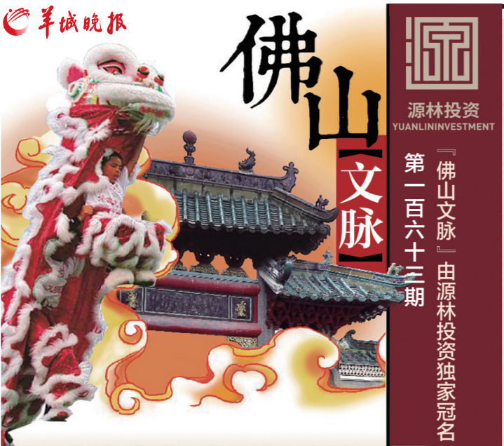
出品 佛山记者站 策划/统筹 谢红