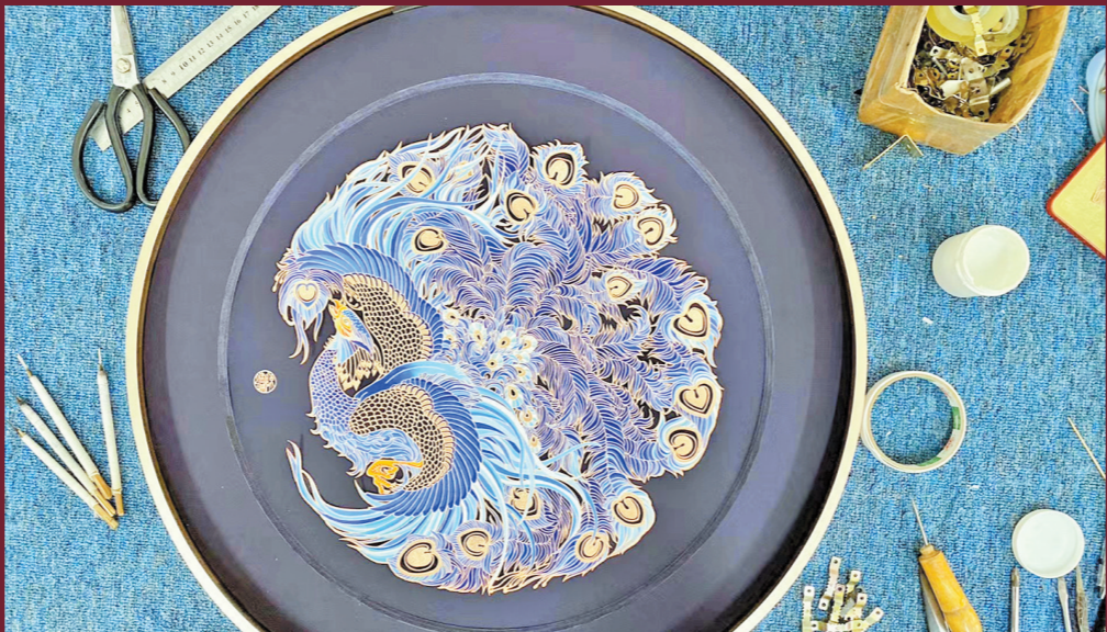
作品《裙裾烂漫》