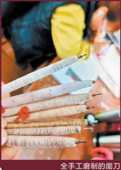
全手工磨制的凿刀