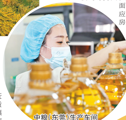
中粮(东莞)生产车间

据了解,2021年东莞市已将麻涌列为市食品饮料产业集群核心区。2022年,东莞市和麻涌镇将各出资1000万元,配套食品产业集聚政策,提升未来产业集聚潜力。目前在广东省餐饮服务行业协会、东莞市餐饮协会等牵头下,包括真功夫等知名企业纷纷前来实地考察,期待能在麻涌开花结果。