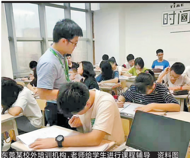
东莞某校外培训机构,老师给学生进行课程辅导 资料图