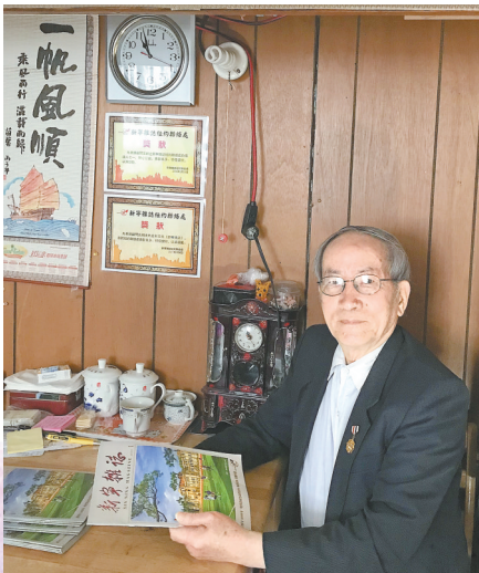
海外台山乡亲钟情《新宁杂志》等侨刊