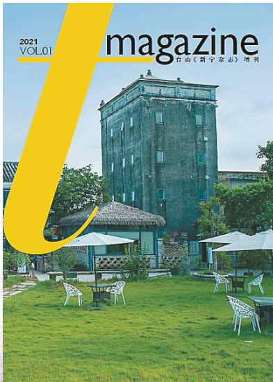
《新宁杂志》中英双语增刊《T-magazine》