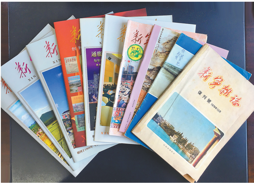
台山目前仍在发行的部分侨刊乡讯

据悉，《新宁杂志》百年以来积累了大量海内外涉侨政治历史、华侨在台山办校兴业情况、侨乡风俗面貌变迁等报道，成为华侨政治、经济、教育、文化历史资料库，具有很高学术研究价值，因而被中山大学图书馆、新加坡国立大学图书馆等国内外知名图书馆收藏。