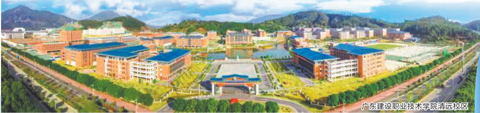
广东建设职业技术学院清远校区

伴随着清远校区的全面落成,广东建院秉持为人民谋幸福的初心,行进在新的“赶考”路上,不断增强师生的获得感。让师生幸福乐业可见、可感、可触,成为广东建院最鲜明的特征之一。