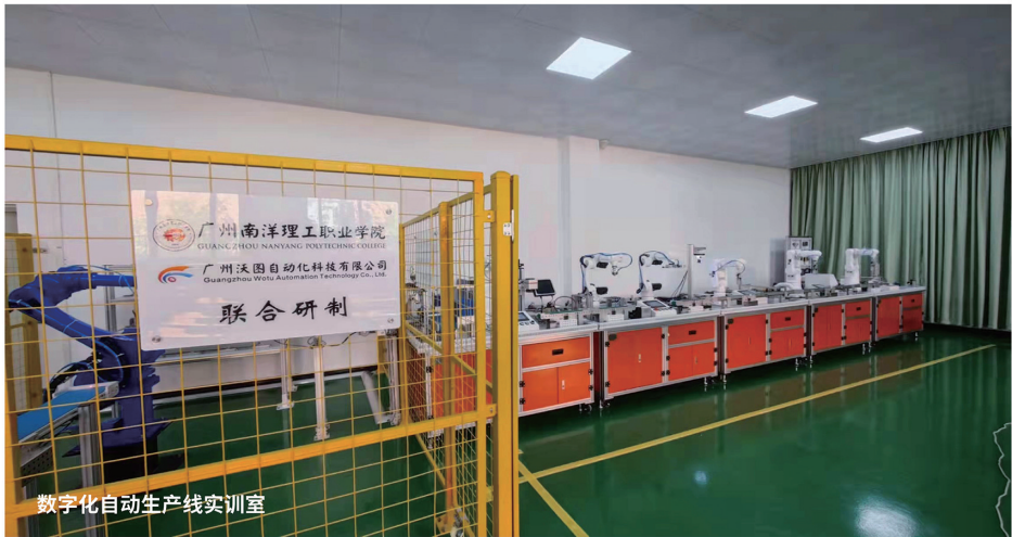
数字化自动生产线实训室