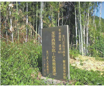
东江纵队在龙门县成立的第一个红色税站——西族东坑税站原址

这是惠州税务部门用活当地红色革命资源，原汁原味学党史、宣讲红色故事、分享所思所悟的一个生动缩影。一直以来，惠州税务充分挖掘本地红色教育资源，做强税务烈士纪念碑品牌，组织开展“撰写一封信、排练一幕戏、编写一本书、创作一组歌、录制一个广播剧、举办一场优秀共产党员先进事迹宣讲会、组织一次‘两优一先’评选表彰”等“七个一”活动，通过深入挖掘革命故事、