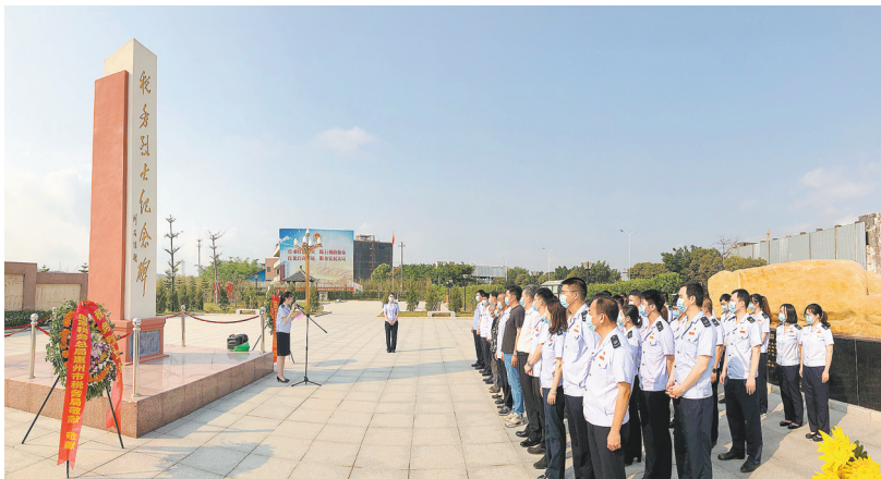
惠州市税务干部到烈士纪念碑开展活动

解放战争时期，粤赣湘边纵队为保障部队供给，借鉴东江纵队抗日时期解决经费的经验，在建立人民武装的地区开辟税站，开展了经常性的税收工作。解放区发展到哪儿，税站就开辟到哪儿，解决了部队的吃饭穿衣和枪支弹药问题，为解放战争的胜利提供了坚实的物质支撑。