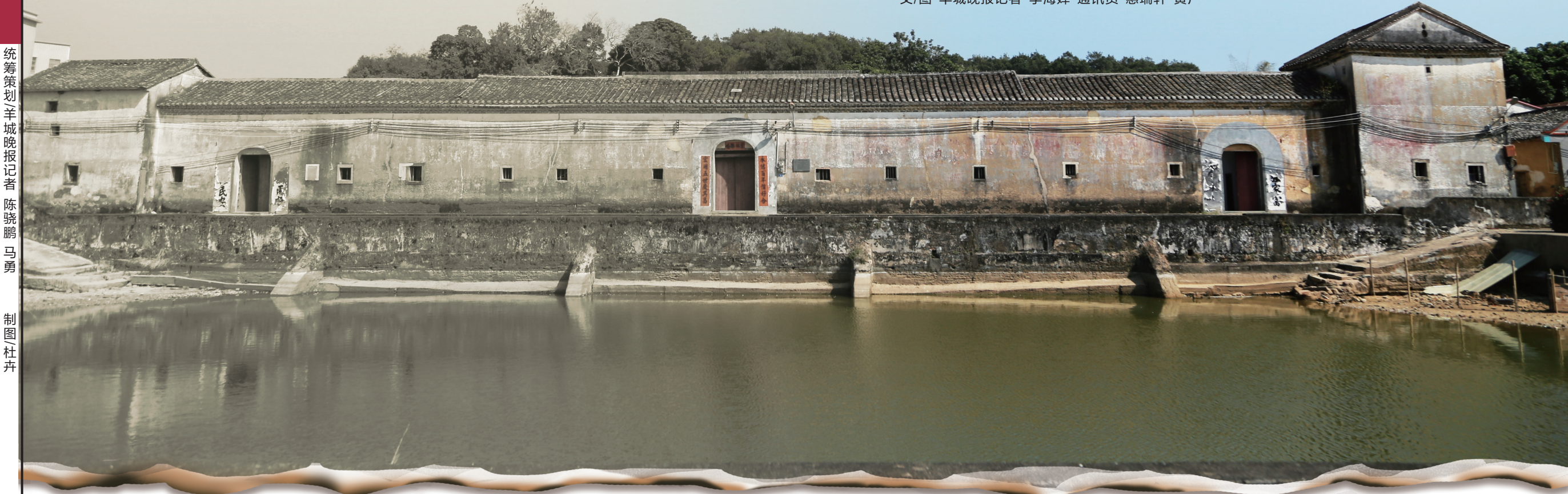
惠阳区牛叶村余庆楼——牛郎径税站驻地遗址

古语云，三军未动，粮草先行。在革命战争年代，东江革命根据地是华南革命根据地的一面旗帜，其中税收起着举足轻重的作用，撑起东江革命根据地的生命线。然而，这段东江红色税收史却鲜为人知，众多无名英雄尘封于历史长河之中。