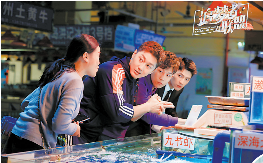
充满广州气息的菜市场入镜

《追梦者联盟》也是广东广播电视台继本地观众家喻户晓的《外来媳妇本地郎》《七十二家房客》后，拟打造的又一长寿剧，志在成为一张粤港澳大湾区新时代的文化名片。和前两部剧的定位不同，《追梦者联盟》将焦点对准了“大湾区”“青春”“时尚”“励志”等关键词，用喜剧化的表达形式，讲述湾区青年面对机遇挑战，勇敢追梦的故事，可谓是热门题材的一次年轻化尝试。