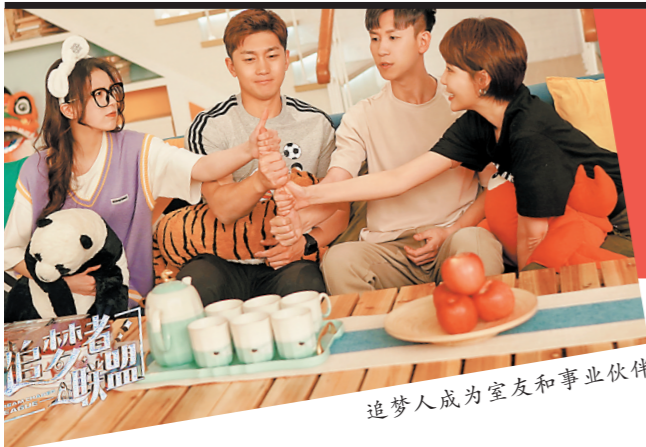
追梦人成为室友和事业伙伴