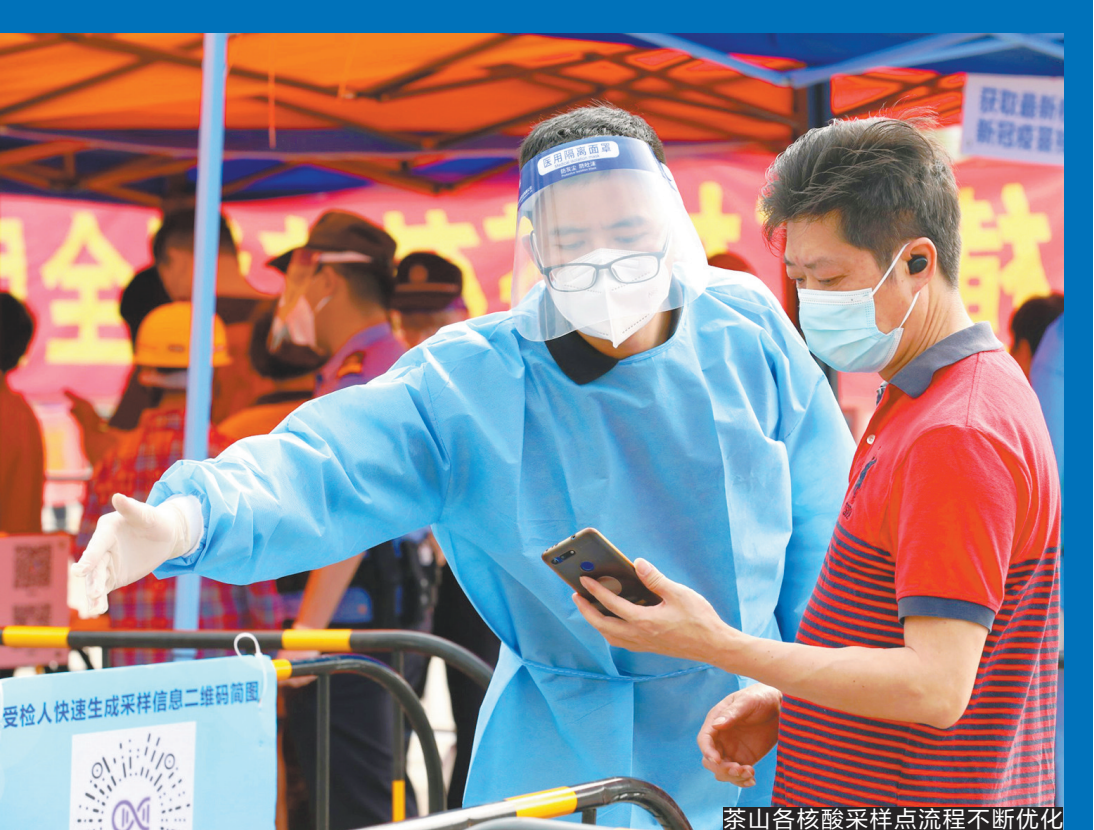
茶山各核酸采样点流程不断优化