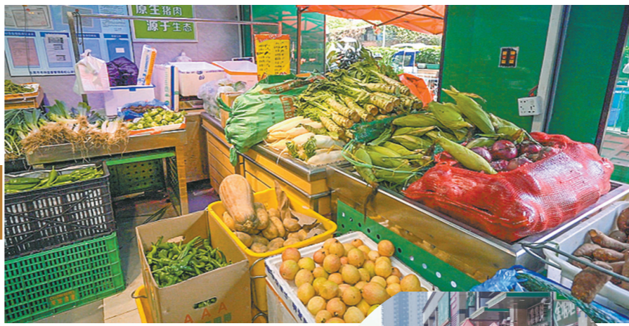
万科金域松湖楼下商超物资充足

充足的物资,为小区居民的日常生活提供了保障。在金域松湖小区群里,被隔离的居民把自家饭菜晒到群里,互相加油打气。青瓜炒肉、菠菜蛋花汤……一道道菜看上去既美味又营养。记者在采访中了解到,在这个常住人口约7500人的小区里,目前每天有70多位志愿者