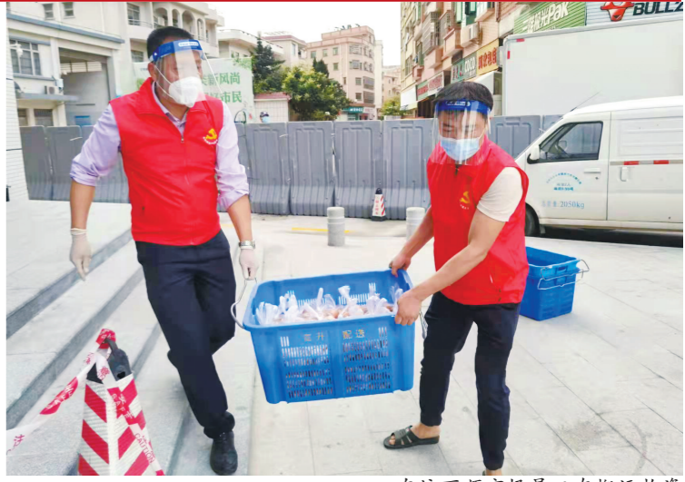
东坑百顺市场员工在搬运物资

成发票申领流程,自2月25日以来,东莞税务部门已累计通过邮寄服务为纳税人办理发票领取超80万份、代开发票超1.6万份。各基层税务部门也发挥税收服务专员工作机制,积极组建专门队伍为风险区域的纳税人、缴费人,提供差异化办税服务,力争为纳税人、缴费人解决实际办税缴费难题。如平常税务部门到村支援的税收服务志愿者兼当“税费政策辅导员”,结合企业情况针对性地宣传优惠政策;松山湖税务部门调配“三师助企工作专班”人员,运用大数据对封控区、管控区企业的情况进行分析预判,通过开通咨询热线、微信服务群为区域内企业提供跟踪服务,帮助企业通过线上渠道及时办理好相关涉税事项。