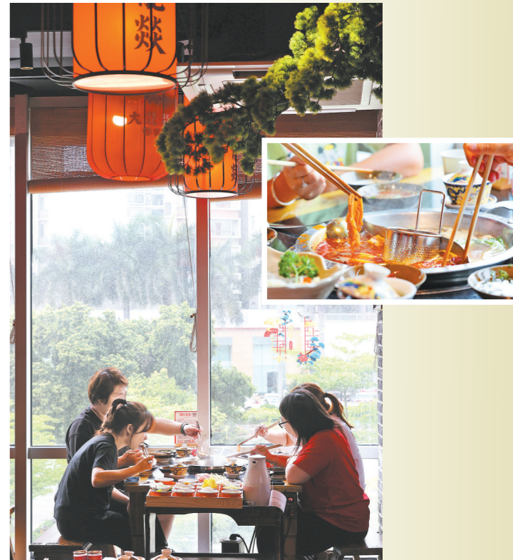
22日上午，华南MALL的一家火锅店内，客人正在用餐