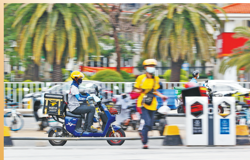
疫情期间，外卖小哥一直忙碌着，他们期待早日与顾客面对面说出那句“您请慢用”