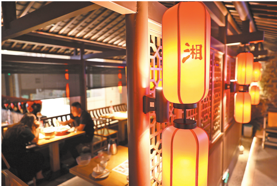
22日东莞放开堂食，一家湘菜馆迎来解封后第一批客人