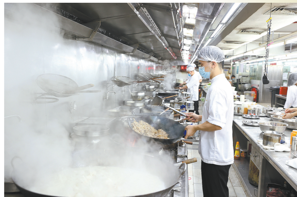
22日一早，东莞一家粤餐厅后厨一派繁忙