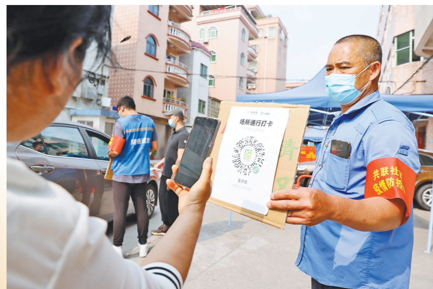
疫情期间，各村(社区)实行围蔽管理，市民积极配合扫码