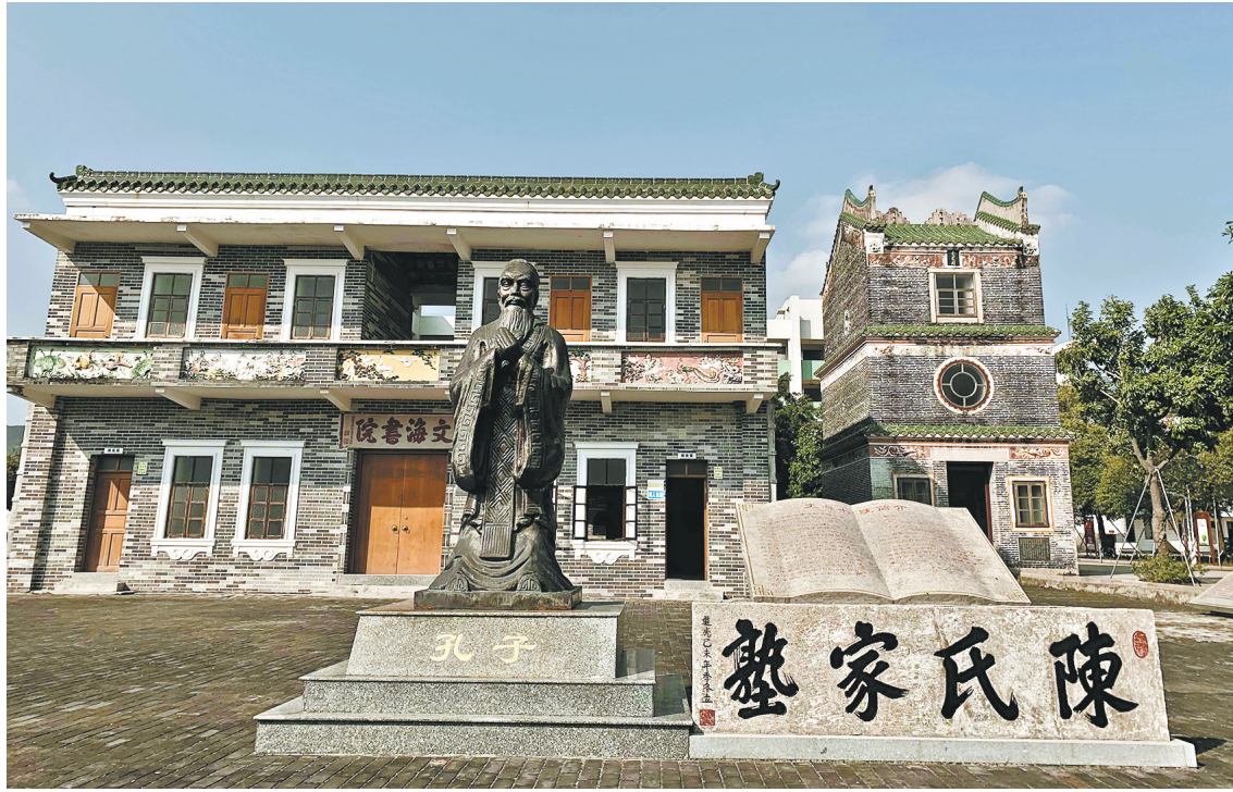
文海书院内重建的魁星阁等建筑

往日，“四大书院”以经书教化幼童；如今，台山台师高级中学、文海中学及广海中学校园内绿树成荫、书声琅琅，生机勃勃的校园气息扑面而来。操场上，篮球、足球、羽毛球各种体育运动异彩纷呈，一个个生龙活虎的身影映入眼帘。去年举行的台山市校园文化建设现场会提出，台山要建设书院校园文化，发挥好教书育人功能，并让红色文化、非遗文化、侨乡文化、海丝文化、排球文化等走进校园，打造书院文化之乡，使书院成为台山的城市文化名片。