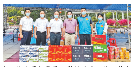
中石化公司领导带队慰问防疫一线工作者

公司党委领导牵头，组织党员志愿者队伍投身抗疫一线，维护核酸检测点的秩序，安排防疫物资慰问防疫一线工作者。