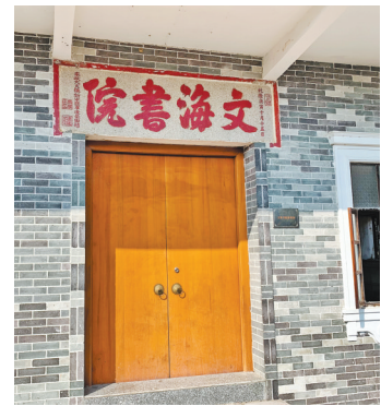
康基田手书“文海书院”石匾

提及“四大书院”，必谈乾隆年间的知县康基田。康基田是乾隆二十二年（1757年）进士，为官数十载，历任多省督抚高官，并著有《多省督抚官志》。为官一任，极重文教的他积极倡建书院。如台山最古老的宁阳书院，最初为清朝雍正九年（1731年）新宁知县王属创立的新宁义学。乾隆三十五年（1770年），康基田为其增筑义学头门一座和藏书楼一所，并更名为宁阳书院。