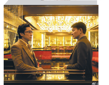
梁朝伟刘德华对峙