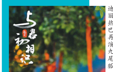
迪丽热巴再演九尾狐